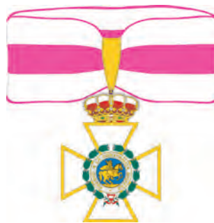
Encomienda de la Real y Militar Orden de San Hermenegildo, según Reglamento del año 1994