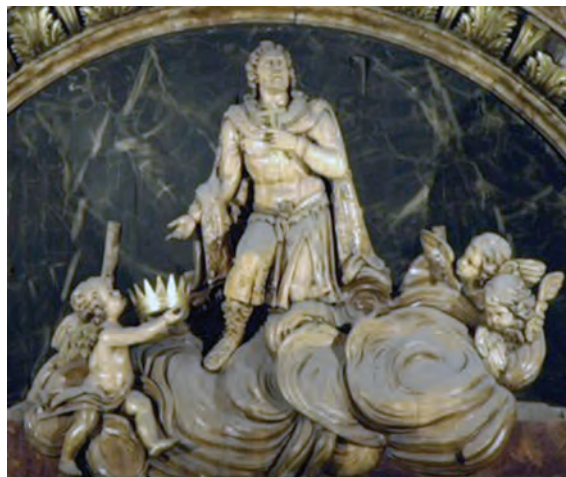
Figura 11. Apotheosis de San Hermenegildo , de Robert Michel. Iglesia de San José, Madrid

Aunque sea a título de curiosidad, reseñaremos la efigie del mártir bordada en el manto procesional de Nuestra Señora de la Angustia, en Sevilla, notable labor del siglo XX con reminiscencias bizantinas e, igualmente más encuadrable en las artes aplicadas, se debe recordar aquí la pequeña figura ecuestre del Santo que se aplica sobre la cinta de la Real y Militar Orden de su nombre en los pasadores para señalar al Caballero de la Orden con placa, además, claro está, de su representación en las insignias, que son objeto de estudio detallado en otros trabajos aquí publicados, recordando de manera escueta que se le presenta, invariablemente, como figura ecuestre, lo que denota sobre todo su carácter militar sobre el puramente hagiográfico que, lógicamente, se hubiera centrado más en el martirio. La imagen del jinete siluetado en líneas doradas sobre fondo azur, se muestra asiniestrada, es decir, mirando hacia la derecha del espectador, contrariando los usos habituales de la heráldica (que se supondrían vigentes también en