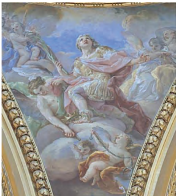
Figura 9. San Hermenegildo de Corrado Giaquinto, en una de las pechinas de la Capilla del Palacio Real de Madrid