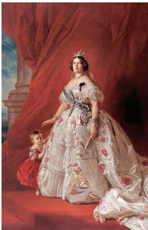
S.M. la Reina Doña Isabel II, II Soberana de la Orden obra de Franz Xavier Winterhalter, 1852