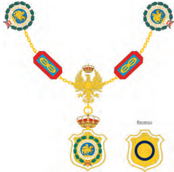
Collar del Gran Canciller de la Real y Militar Orden de San Hermenegildo, según Reglamento del año 2000

En la parte central pendiente el Escudo de la Orden, sobre cartela de esmalte blanco fileteada de oro, sembrada de tallos vegetales en oro formando ondas y volutas. La bordura lleva la inscripción en oro: «PREMIO A LA CONSTANCIA MILITAR», rodeado el conjunto de dos ramas de laurel unidas por sus troncos y liadas en punta con lazo de gules. El todo timbrado de Corona Real. Al reverso, en esmalte blanco, inscripción grabada en oro: «F.VII» y bordura de azul