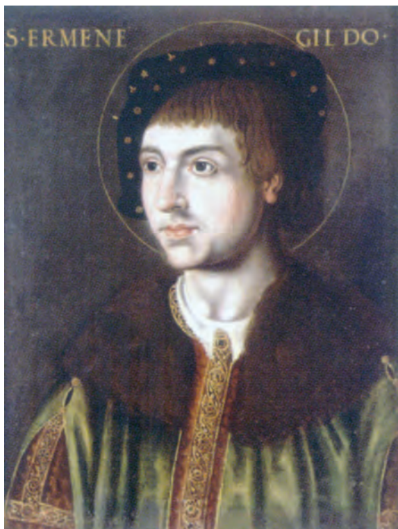
Figura 2. Busto de San Hermenegildo (hacia 1583), de Antonio Estela. Real Colegio Seminario del «Corpus Christi» (Valencia)

defender que esa difuminada Teodosia, hermana de los santos cartageneros Leandro, Isidoro, Fulgencio y Florentina, habría sido la madre de Hermenegildo y de su hermano Recaredo, es decir, que a la excelsa familia de dichos santos se incorporaban así un mártir y el soberano que bautizó a la católica monarquía española.