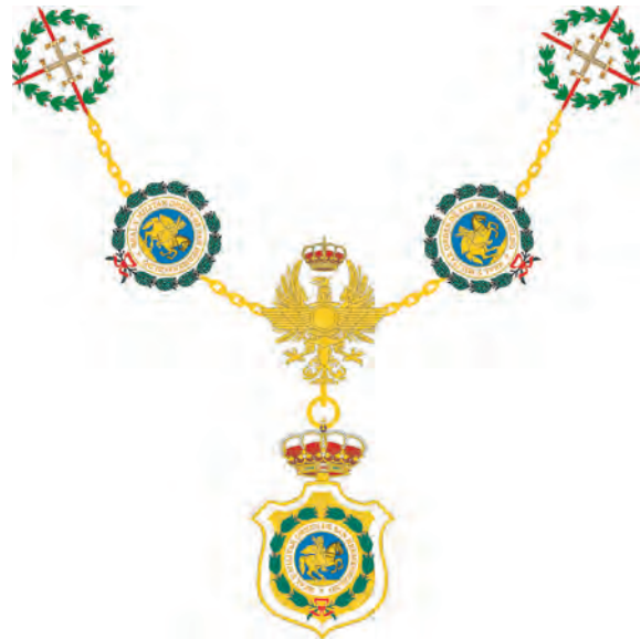
Collar del Gran Canciller, de la Real y Militar Orden de San Hermenegildo, según Reglamento del año 1994

central lleva el emblema interejércitos del que pende una medalla con el Escudo de la Orden. El Collar del Gran Canciller será modificado en el siguiente Reglamento pocos años después.