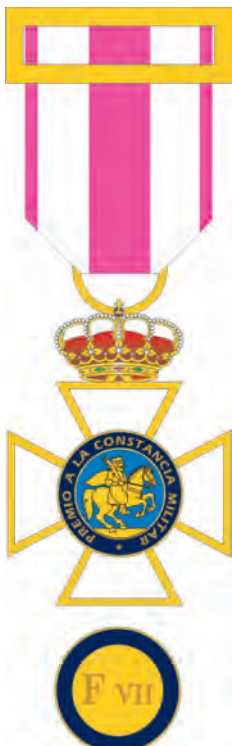
Cruz de la Real y Militar Orden de San Hermenegildo, según Reglamento del año 1994

En su artículo 2º. Categorías: dice que estará integrada la Orden por Caballeros y Damas. Esta novedad es como consecuencia del ingreso en las Fuerzas Armadas de las mujeres en todos los grados y en todas las escalas.