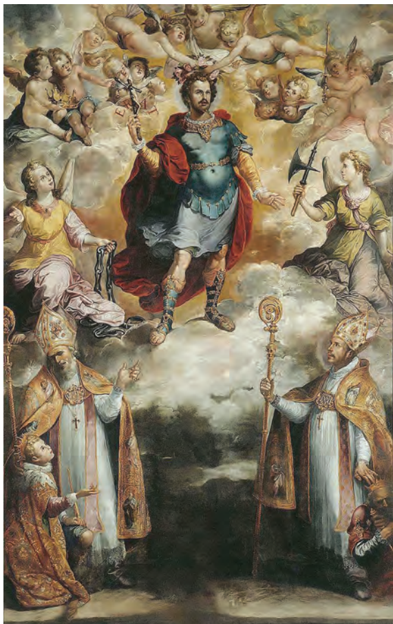
Figura 4. Apoteosis de San Hermenegildo, de Francisco de Herrera el Viejo, hacia 1620 Museo de Bellas Artes de Sevilla

Hermenegildo, fallecido en Tarragona el 13 de abril del 585, alcanzó el más alto estatus posible, la santidad, por el martirio, al ser canonizado, a petición del rey Felipe II, por el papa Sixto V, el 14 de abril de 1585, como Mártir de la Iglesia Católica, en el milésimo aniversario de su muerte, y es Patrón de los conversos de la Monarquía española, y de la Real Hermandad de Veteranos de las Fuerzas Armadas y Guardia Civil. Su festividad se celebra en el aniversario de su muerte, el antes mencionado día 13 de abril, mientras que la Iglesia Ortodoxa lo celebra el 14 de noviembre. No debemos olvidar que Felipe II tuvo graves problemas con su propio hijo, el príncipe don Carlos, pero este vástago no puede adornarse con la palma del martirio sino simplemente con la desgracia de la enfermedad mental congénita que padeció. Por otra parte, don Felipe II tuvo durante todo su reinado problemas derivados de los conversos: los falsos conversos judíos y mahometanos al catolicismo y los conversos del catolicismo al protestantismo.