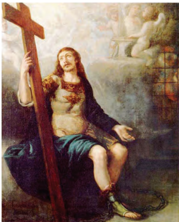
Figura 7. San Hermenegildo en prisión , hacia 1656, de Juan Carreño de Miranda, Museo de Bellas Artes de Oviedo

crucero de la Iglesia de San Isidoro (Sevilla). Igualmente en El Tránsito de San Hermenegildo (1603), depositado en Sevilla (Museo de Bellas Artes) original de Alonso Vázquez (h.1575-1645) y Juan de Uceda (h.1570-1635), que se atribuyó tradicionalmente a Juan de Roelas, y estaba destinado al Hospital de las Cinco Llagas de Sevilla (Figura 3). Su composición, similar a la del Entierro del señor de Orgaz , muestra a la Virgen al frente de la Corte Celestial recibiendo al Mártir en la Gloria. Imprescindible, la Apoteosis de San Hermenegildo (Figura 4), obra de grandes dimensiones (523 x 326 cm) de Francisco de Herrera el Viejo (Sevilla, 1576 – Madrid, 1656) ejecutada hacia 1620 para el colegio que la Compañía de Jesús regía en Sevilla bajo la advocación del santo, hoy en el Museo de Bellas Artes de Sevilla, obra en la que también aparecen San Isidoro y San Leandro; San Hermenegildo (h. 1625), obra atribuida con visos de verosimilitud a Francisco de Zurbarán (1598-1664), es un óleo sobre lienzo en la Iglesia hispalense de San Esteban (Figura 5), fechable en la primera mitad del siglo XVII y de muy sobria composición.