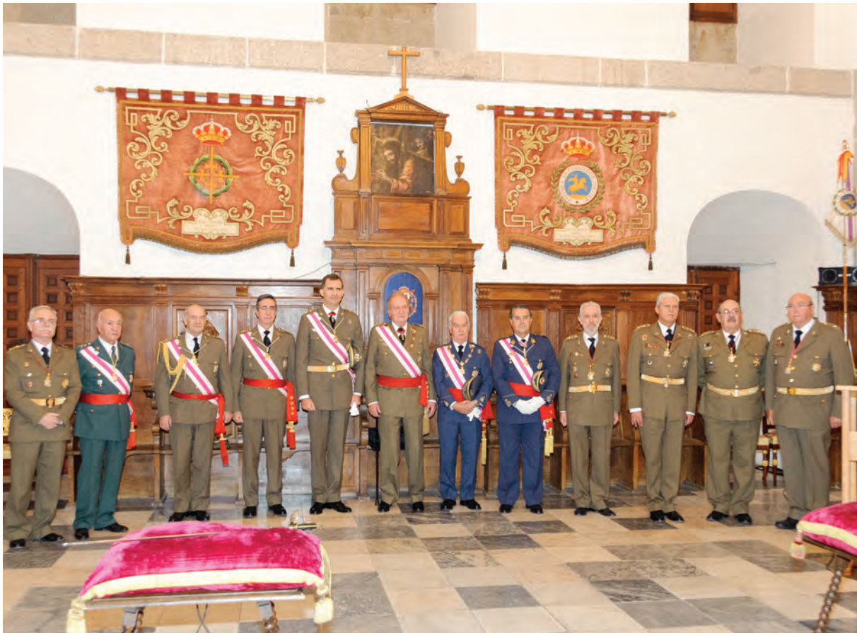
Capítulo de 2º Centenario de la Orden en 2014, S.M. el Rey con Autoridades y la Comisión Ejecutiva

en lo religioso dentro del arrianismo comprensivo. Destacan en prueba de ésto que su primera esposa fue la católica Teodosia, hermana de San Leandro, San Fulgencio, Santa Florentina y San Isidoro. Católica era Ingunda, esposa de Hermenegildo, y Ringunta, la prometida de Recaredo de cuyos esponsales trató Leovigildo en plena campaña contra Hermenegildo.