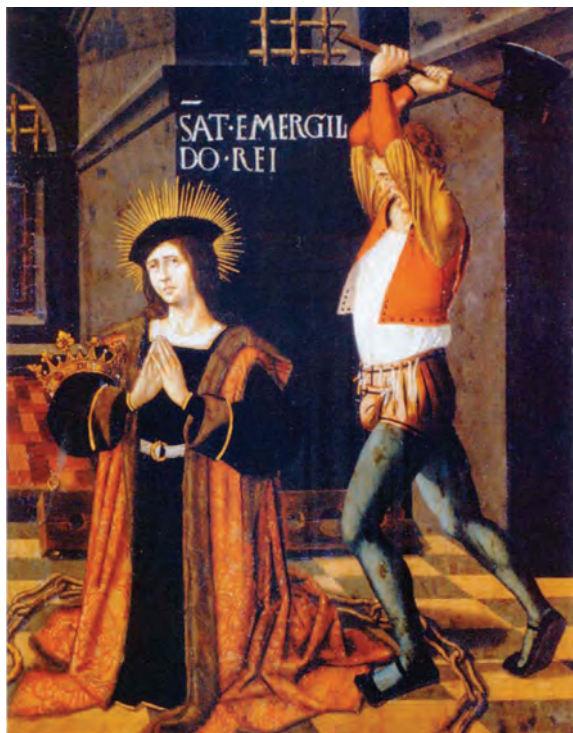
Figura 1. Martirio de San Hermenegildo, tabla de artista flamenco del siglo XV en el Museo de Bellas Artes de Granada

Al acometer el estudio iconoprosopográfico del príncipe y mártir Hermenegildo es conveniente recapitular alguno de los datos que se refieren a su crónica vital, ya que su vida y muerte, y su canonización al cabo de un milenio, están teñidas de matices políticos e ideológicos que señalaremos, aunque sea brevemente, pues esta operación es necesaria para intentar comprender el mensaje que pretende transmitirnos buena parte de su iconografía.