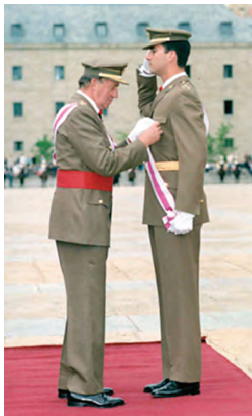
Capítulo 1999 S.M. el Rey D. Juan Carlos I imponiendo la Gran Cruz Ingresando el Heredero actual S.M. Felipe VI