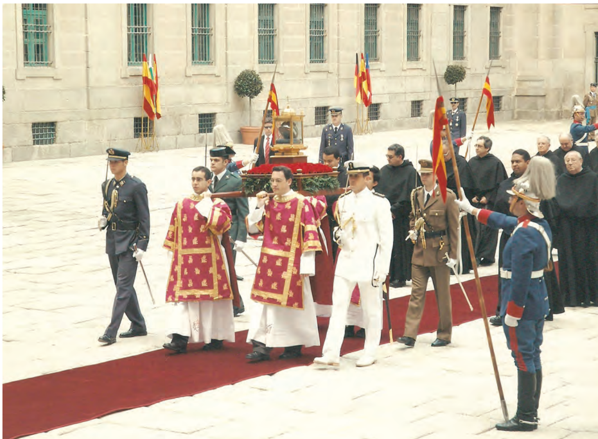
Procesión con el cráneo de San Hermenegildo