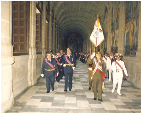
Procesión para dirigirse al Capitulo

Treinta mil sueldos de oro bastan a Leovigildo para comprar la defección del Prefecto bizantino dejándole abierto el camino de Sevilla. Hermenegildo acepta el consejo de sus generales y envía trescientos hombres escogidos al castillo de Osset (San Juan de Aznalfarache), al otro lado del río, para quebrantar de flanco al atacante y caer luego sobre el grueso desorganizado. Su padre adivina el peligro, asalta el castillo y se vuelve después contra los suevos, cuyo rey Mir'n se ve obligado a jurarle fidelidad y a retirarse enfermo a Galicia.