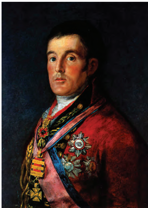
Lord Arthur Wellesley, vizconde de Wellington y duque de Ciudad Rodrigo