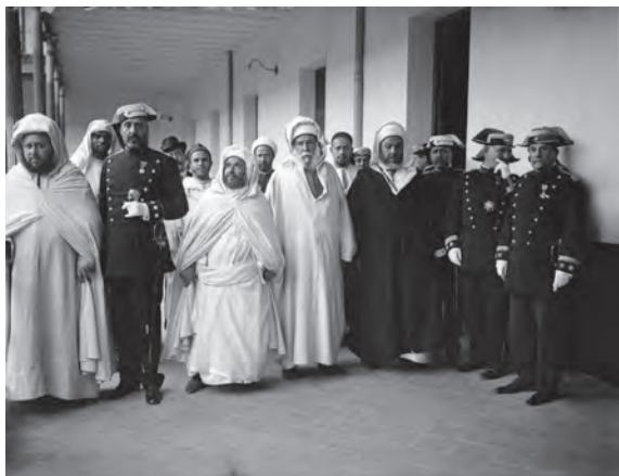
Puerta actual Jefatura DEPRONA Móvil Madrid 1º planta en 1900, donde se ve un grupo de Guardias Civiles con marroquis, donde se ven dos placas y una Cruz de San Hermenegildo