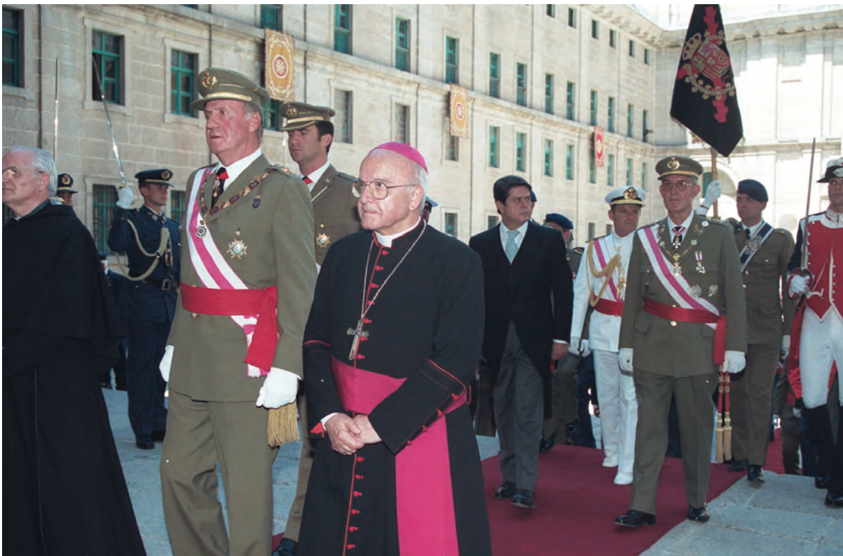
SM el Rey en la procesión acompañando el Craneo de San Hermenegildo

La hipótesis adversaria parte del principio cierto de que Leovigildo fué un gran monarca y un gran caudillo, cuya visión de la unidad política se basaba