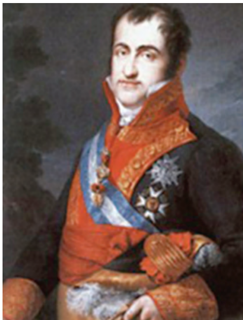
SM. el Rey Fernando VII

Orden hasta la actualidad, el que “han de ser los Oficiales de una acreditada conducta , sin nota fea en sus costumbres, ni haber sido procesados por algún Delito” .