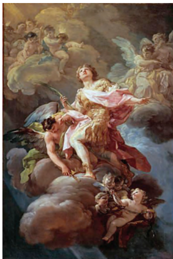
Figura 8. San Hermenegildo de Corrado Giaquinto, Casita del Príncipe de San Lorenzo de El Escorial

En el presbiterio del templo parroquial que bajo la advocación de Hermenegildo hay en Madrid encontra-