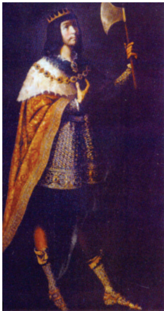
Figura 5. San Hermenegildo (h. 1625), obra atribuida a Francisco de Zurbarán Iglesia de San Esteban, Sevilla

Hermenegildo, durante su reinado en Andalucía, levantó una Iglesia de la que procede una lápida, llamada Dintel de San Hermenegildo , hoy conservada en el Museo Arqueológico de Sevilla, con una inscripción que dice: In nomine Domini anno feliciter secundo regni domini nostri [H]ermenegildi regis quem persequitur genitor sus dominus Liuvigildus rex in ci[b]vitate [H]lspa[lense] indictione tertia decima [...] 10 .