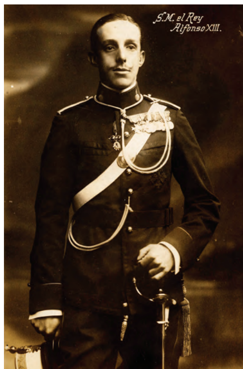
S.M. el Rey Don Alfonso XIII, VIII Soberano de la Orden