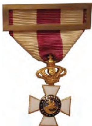
Cruz de la Orden de San Hermenegildo, primera época