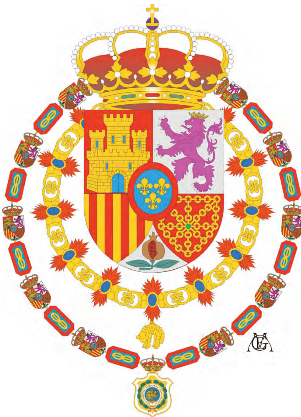
Escudo del nuevo Soberano de la Orden de San Hermenegildo

El resto de los elementos siguen iguales con excepción del Escudo de la Comisión Ejecutiva que desaparece.