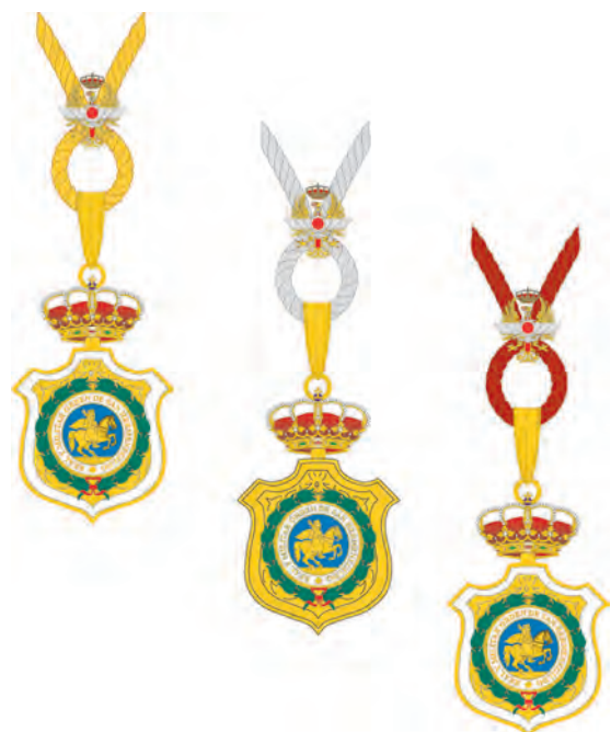
Medallas pectorales de las diversas categorías de la Real y Militar Orden de San Hermenegildo, según Reglamento del año 1994