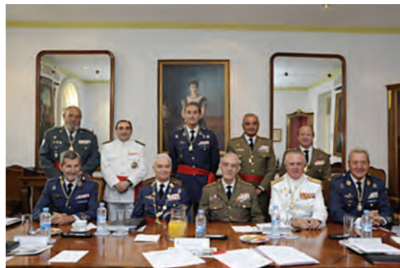
Relevo del Gran Canciller en 2013

A partir de 1918 y, en concreto, en el Quinto Reglamento de la Orden, de 1920, se crea la Medalla Militar Individual que sustituye a la Cruz de San