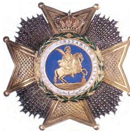
Placa de la Gran Cruz de San Hermenegildo

La Placa será también de oro, con escamas brillantadas del mismo metal en sus brazo, y entre éstos llevará cinco rayo unidos de plata, también brillantados; cada brazo tendrá dos puntas rematada en pequeños globos de oro; el centro contendrá un círculo de este metal, con una corona de laurel de esmalte verde que rodeará un campo azul con la efigie del Santo en los mismos términos indicado para la Cruz sencilla con inclusión del lema que se colocará sobre esmalte blanco con letra de oro entre aquel y la corona de laurel