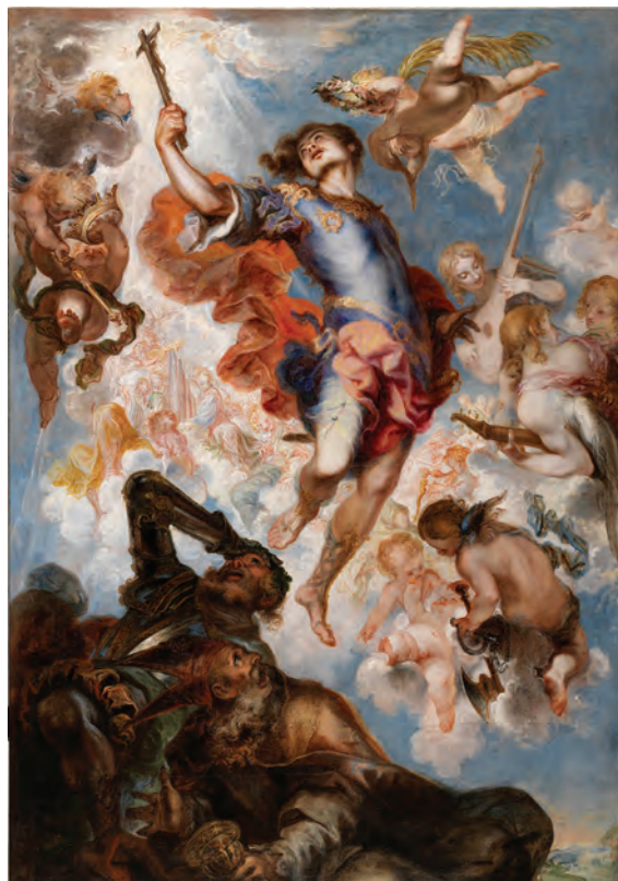
Figura 6. El Triunfo de San Hermenegildo , 1654, de Francisco de Herrera el Mozo, Museo del Prado

No son muchas las obras de cierto relieve artístico dedicadas a San Hermenegildo, destacando más por su mérito las pictóricas sobre las escultóricas. Esta relativa pobreza iconográfica en comparación