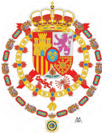
Escudo del Soberano de la Real y Militar Orden de San Hermenegildo, según Reglamento del año 1994