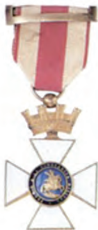
Cruz de la Orden de San Hermenegildo

La Orden sigue su devenir tranquilo y solo se producen algunas “Acordadas” de la Asamblea y Reales Decretos para aclarar asuntos menores, como curso de instancias, distribución de pensiones, estado (actual Estado-Propuesta) de tiempos que debe acompañar las peticiones, plazo de seis meses para cursar