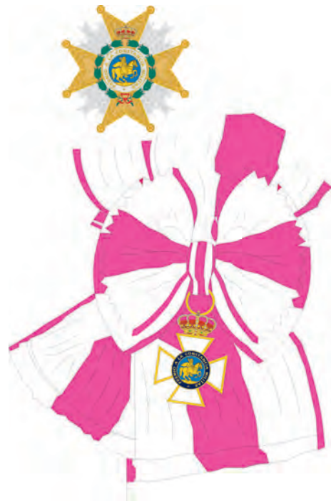
Gran Cruz, con su Placa y banda de la Real y Militar Orden de San Hermenegildo, según Reglamento del año 1994