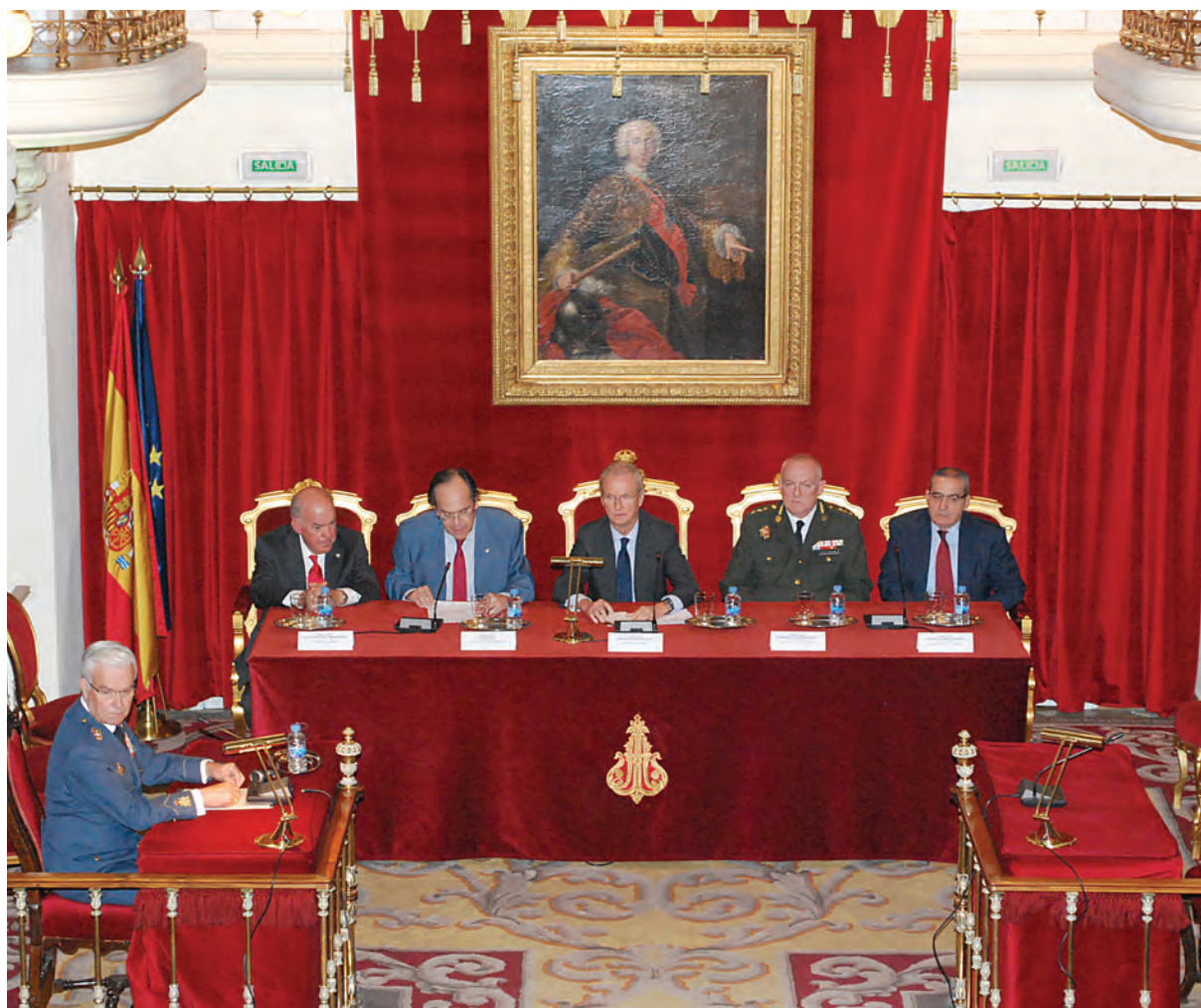
Sala de juntas de la Real Academia de Jurisprudencia y Legislación

Y es que una Institución jerarquizada, unida por un código deontológico de valores muy específicos entre los que la disciplina es exigida de forma estricta mediante un Código Penal Militar y una Ley de Régimen Disciplinario no podía dejar de equilibrar con reconocimientos y estímulos el cum-