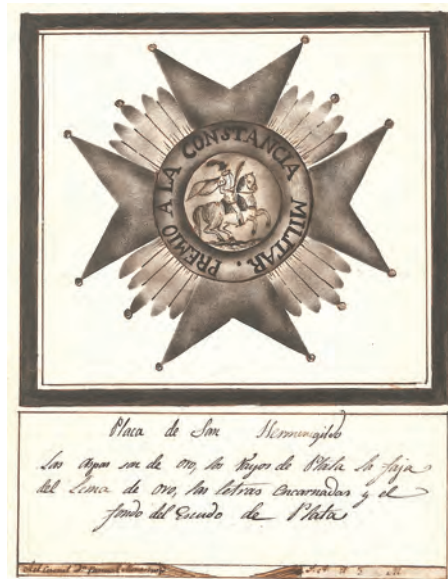
Diseño que mandaban para bordar la placa

En el artículo 41 se crea la Grande Cruz para Generales cuyo distintivo será "una placa de oro igual a la venera, bordada, que se llevará al lado izquierdo, y una banda ancha del color de la cinta", Igualmente llevarán solo la placa, sin banda; los que con el mismo número de años que marca el reglamento, para los Generales, desde Brigadier para abajo.