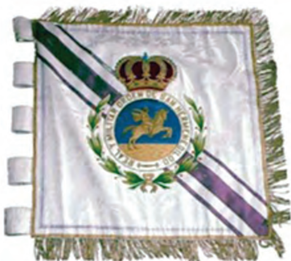
Orden de San Hermenegildo

bios que se podrían definir como apreciables, son los siguientes: