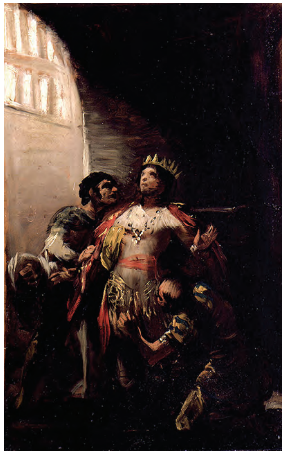
Figura 10. San Hermenegildo en prisión (h. 1802), de Goya, Museo Lázaro Galdiano