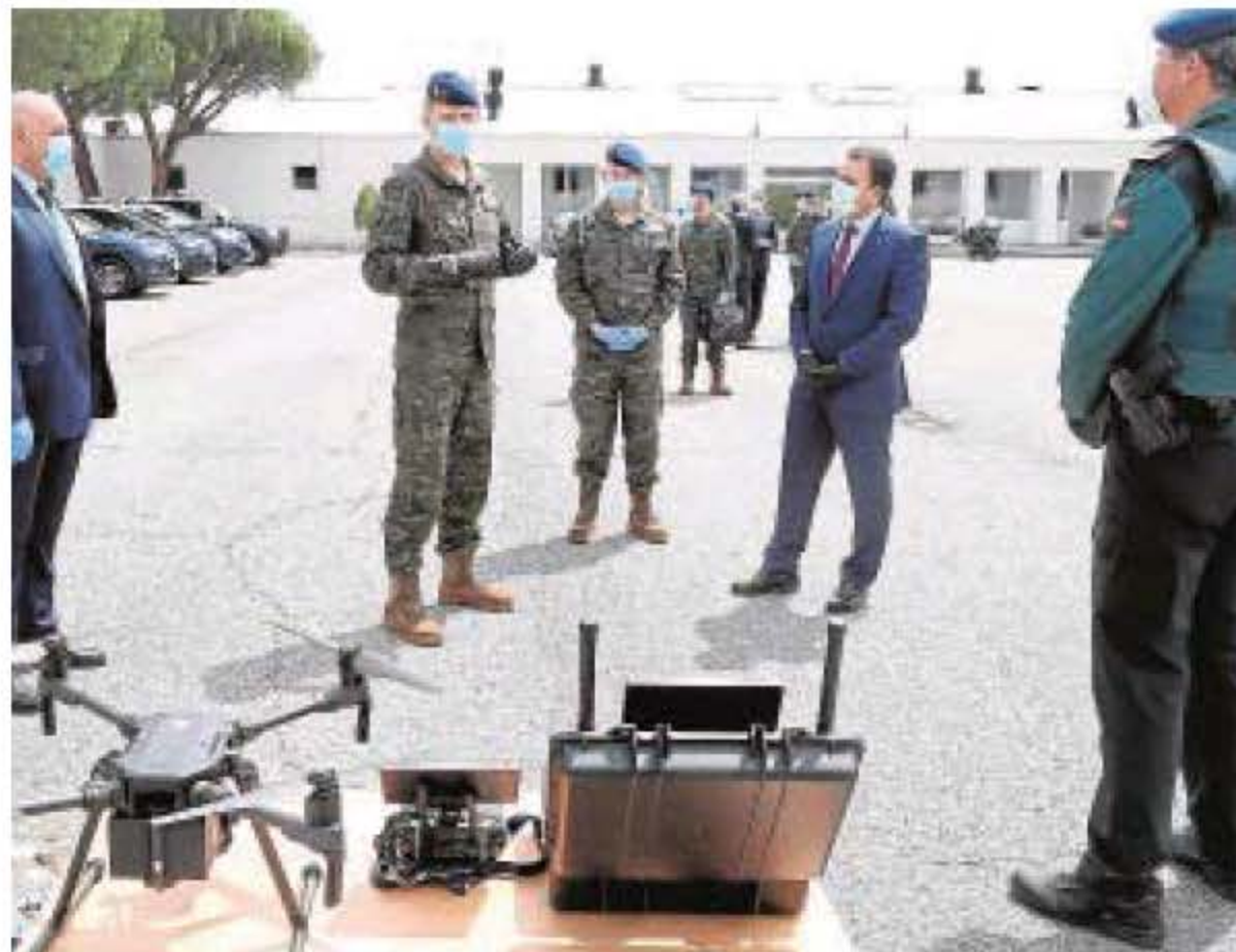
Don Felipe visita la Unidad de Seguridad de la Casa del Rey

Al comienzo de la visita a la Guardia Real, Don Felipe recibió informa-