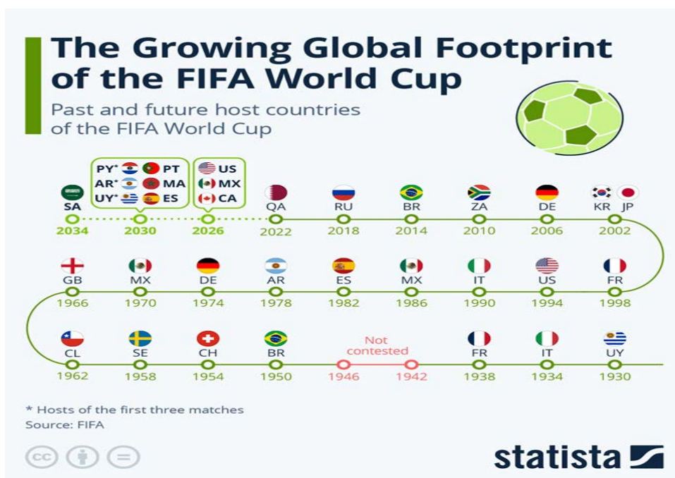
Figura 4. La creciente presencia global de la Copa Mundial de la FIFA.

Pero el debate de fondo va mucho más allá del reparto de plazas. La ampliación del Mundial constituye una respuesta a una cuestión central: ¿quién define hoy las reglas del fútbol global y qué regiones marcarán su futuro?