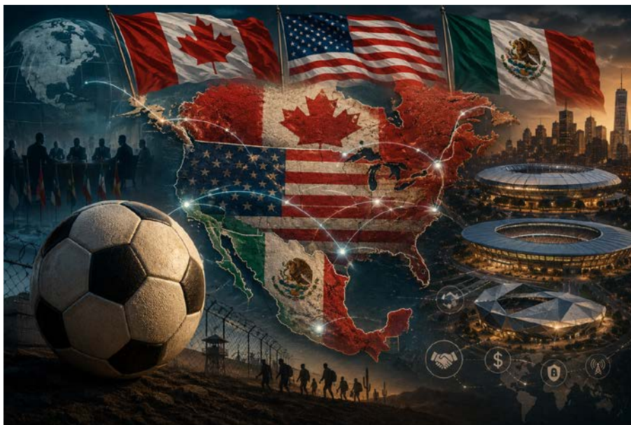
Figura 1. La Copa del Mundo de 2026.

La relación entre deporte y geopolítica ha adquirido una visibilidad creciente.