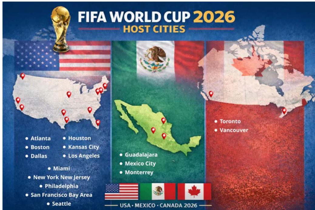
Figura 5. Dieciséis ciudades anfitrionas en tres países.

Las relaciones entre los tres países anfitriones atraviesan, además, uno de sus momentos más complejos de los tiempos recientes. Las tensiones comerciales entre Washington y Ottawa, las disputas en torno a la inmigración y la amenaza de nuevos aranceles han convertido el torneo en un espacio donde se proyectan rivalidades y agendas que desbordan el marco competitivo.