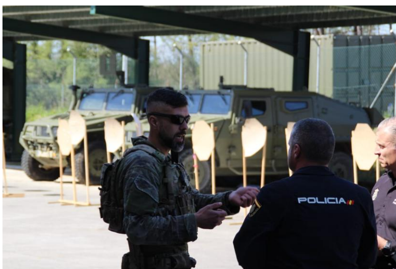
Foto 1: “ Brifing ” conjunto previo a una operación con participación de capacidades militares y policiales.

La cooperación entre fuerzas policiales y militares no es un fenómeno nuevo, pero su naturaleza, objetivos y su grado de integración han variado significativamente en las últimas décadas. Durante buena parte del siglo XX, ambos ámbitos operaban en esferas separadas y con cometidos diferentes: las fuerzas armadas se encargaban de la defensa frente a amenazas externas mientras las policías se centraban en el mantenimiento del orden público y el estado de derecho interno. Sin embargo, los conflictos contemporáneos, y en especial los surgidos tras la Guerra Fría, han difuminado esas fronteras tradicionales. Las circunstancias geoestratégicas actuales demandan respuestas conjuntas ante las amenazas híbridas y la naturaleza poliédrica de los conflictos 1 .