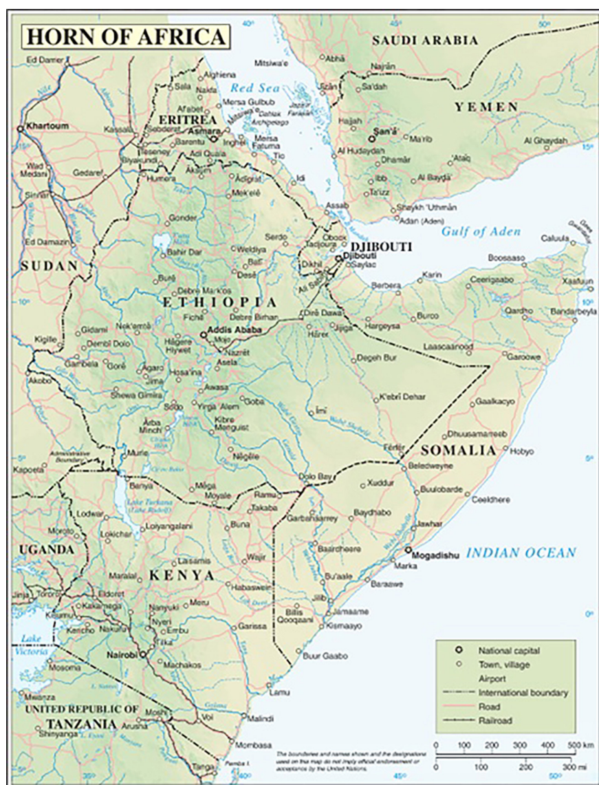
Figura 1. Mapa del Cuerno de África.

El Cuerno de África funciona hoy como un pivote estratégico donde la seguridad del mar Rojo se entrelaza con las ambiciones de potencias emergentes (EAU, Turquía, Arabia Saudí) y globales (China, Rusia, EE. UU.).