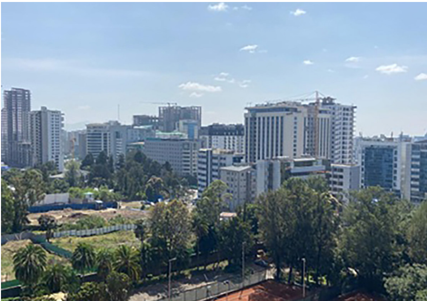
Figura 4. Paisaje del centro de Adís Abeba.

La presencia china en Etiopía sufre una paradoja. Los chinos son dueños de todo el hormigón, pero no pueden llevarse el dinero a