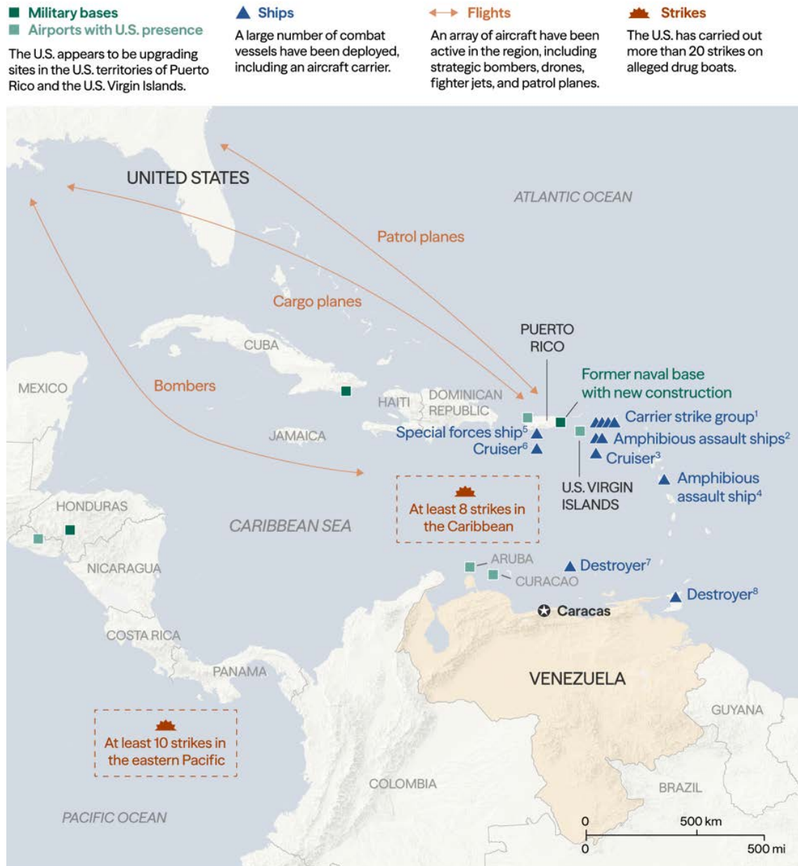
Figura 5. Presencia militar estadounidense en el Caribe en diciembre de 2025.

U.S. military presence as of December 1, 2025