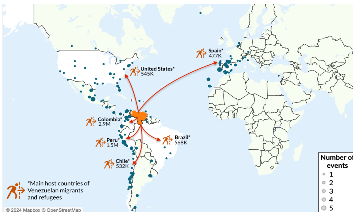
Figura 4. Manifestaciones tras las elecciones presidenciales de Venezuela de 2024 en los principales países con población venezolana.

El papel de las Fuerzas Armadas ha sido determinante. Lejos de constituir un actor neutral, el estamento militar se ha integrado progresivamente en la estructura de gobierno, asumiendo responsabilidades administrativas y económicas. Esta fusión de poderes refuerza la estabilidad interna del régimen, pero, al mismo tiempo, desplaza la fuente de legitimidad desde el consentimiento hacia la capacidad de control de una sociedad civil cada vez más reactiva, tanto interna como externa.