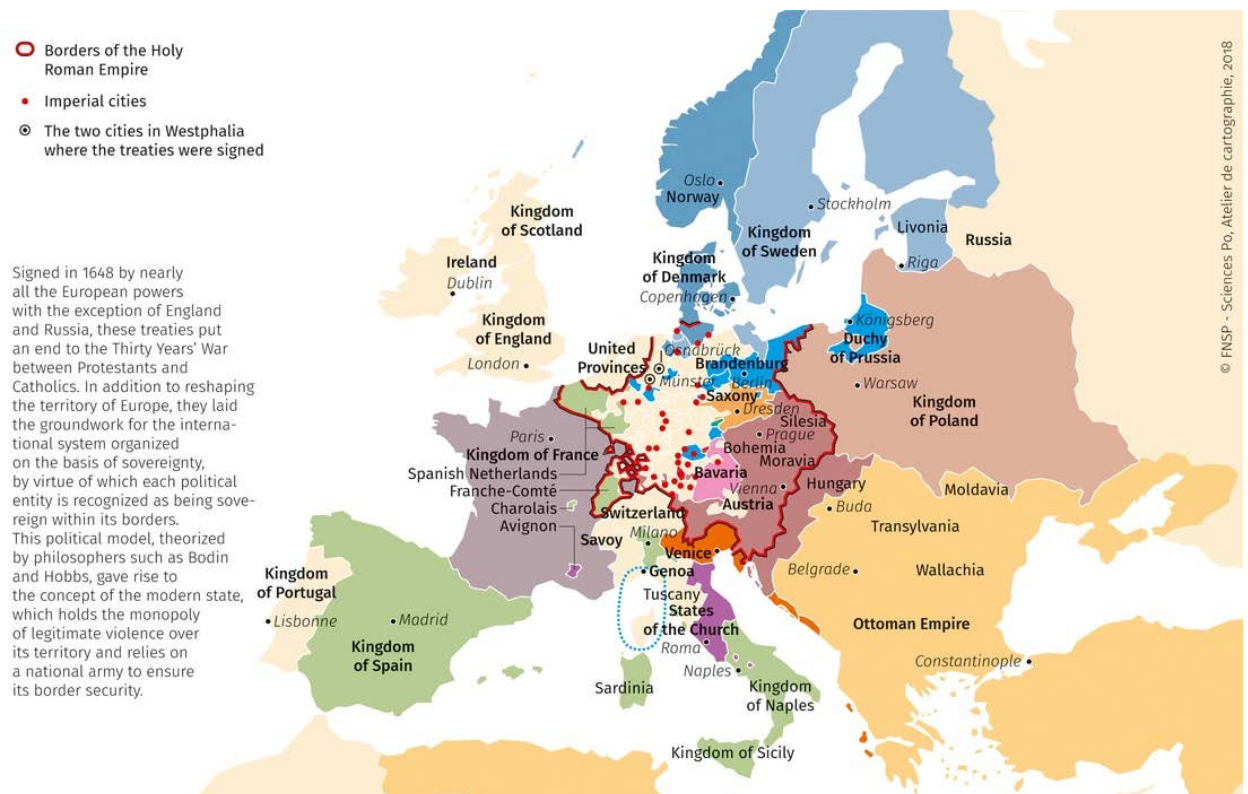
Figura 1. Europa tras los tratados de Westfalia, 1648.

El sistema internacional moderno se consolidó sobre una arquitectura jurídica y política cuyo núcleo fue la soberanía territorial. La autoridad quedó así definida como exclusiva dentro de fronteras delimitadas, y el reconocimiento mutuo entre entidades políticas se convirtió en el mecanismo que reducía la incertidumbre estructural de un entorno anárquico. Como primer resultado, esta configuración no eliminaba el conflicto, pero lo encauzaba en un marco en el que el Estado soberano era, al mismo tiempo, actor y límite.