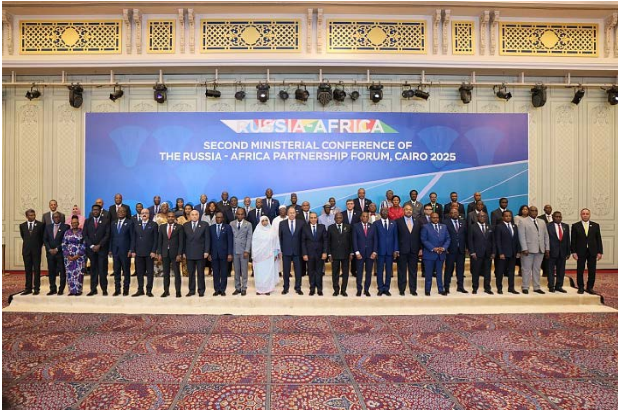
Figura 3. Imagen de la II Conferencia Ministerial del Foro de Asociación Rusia-África.

estabilizó la política interna al marginar a la oposición y a los políticos más cercanos a Francia. Esta es una estrategia que Rusia ha usado durante años y comienza con diplomáticos aproximándose a líderes africanos, tras lo cual se firman acuerdos de seguridad y finalmente con compañías de explotación de recursos 36 .