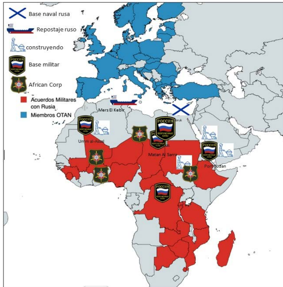
Figura 2. Despliegue de las fuerzas rusas en África y el Mediterráneo.

la integración en las cadenas de valor y el desarrollo de capacidades nucleares civiles 20 . No obstante, es importante destacar la brecha entre memorandos y ejecución real, ya que numerosos acuerdos no se traducen en grandes inversiones industriales o en explotación sostenida debido a limitaciones logísticas, financieras y de seguridad que las propias fuentes rusas reconocen. Por ello conviene distinguir entre la intención estratégica y la capacidad efectiva de ejecutar proyectos en entornos volátiles.