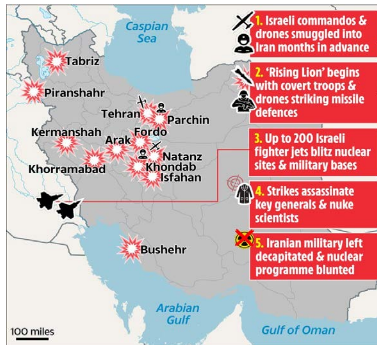
Ilustración 2. Secuencia de la operación Rising Lion .

daños significativos. Igualmente, Israel atacó la planta de conversión de uranio de Isfahan, que proporcionaba este material configurado para poder ser enriquecido en Natanz y Fordow. Aunque no se tiene constancia, parece que el polígono de experiencias de Parchín también fue atacado. 20