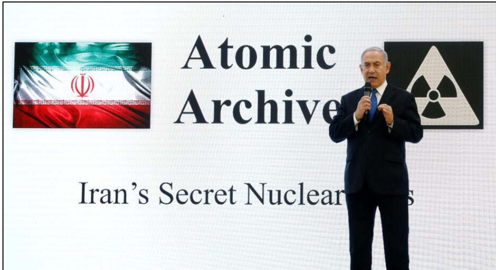
Ilustración 1. El primer ministro israelí, Benjamin Netanyahu, detalla la investigación sobre los planes nucleares de Irán durante una conferencia de prensa en el Ministerio de Defensa en Tel Aviv, el 30 de abril de 2018.

El año 2020 destacó por un atentado sin atribuir contra la planta de enriquecimiento de uranio de Fordow, pero sobre todo por el asesinato de Mohsen Fakhrizadeh, considerado como el científico iraní más importante en el programa nuclear iraní y que había sido señalado por Netanyahu en sus declaraciones de 2018 10 . El año 2021 contempló un ataque contra la planta de enriquecimiento de Natanz, que Irán igualmente atribuyó a Israel 11 . Toda esta serie de actuaciones parece que iban encaminadas a retrasar el máximo posible un posible programa militar iraní. No obstante, las capacidades israelíes no habían podido destruir el programa iraní en la misma forma que lo habían conseguido anteriormente en Irak y Siria.