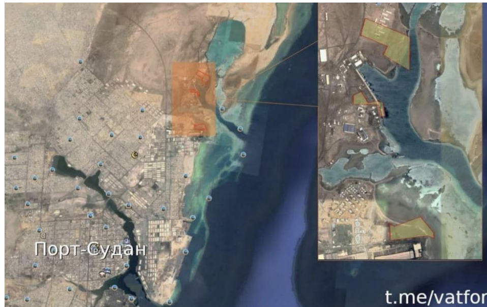
Figura 4. Posición de las tres parcelas destinadas a la base naval rusa en Puerto Sudán.

Según el acuerdo bilateral, la base acogería a 300 militares y podrían atracar en ella hasta 4 buques de guerra, incluyendo aquellos de propulsión nuclear 39 . Este acuerdo tendría una validez de 25 años, y se renovaría cada 10 años si ninguna parte se opusiera en un plazo mínimo de un año al fin del acuerdo 40 . De materializarse el proyecto, Rusia lograría una importante base naval en el mar Rojo que le brindaría múltiples posibilidades. Por ejemplo, este puerto afianzaría la unión entre Moscú y Jartum a través de la cooperación en defensa, una de las herramientas predilectas del Kremlin en sus relaciones con Estados africanos 41 . Estas instalaciones también permitirían a Rusia ejercer mayor control sobre una ruta marítima vital ubicada entre dos cuellos de botella (el canal de Suez y Bab al-Mandeb), así como amenazar los intereses de la OTAN y de la UE en el mar Rojo 42 .