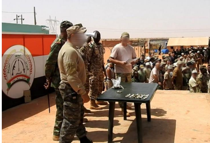
Figura 2. Entrega de condecoraciones de mercenarios de Wagner a miembros de las Fuerzas de Apoyo Rápido en 2019.