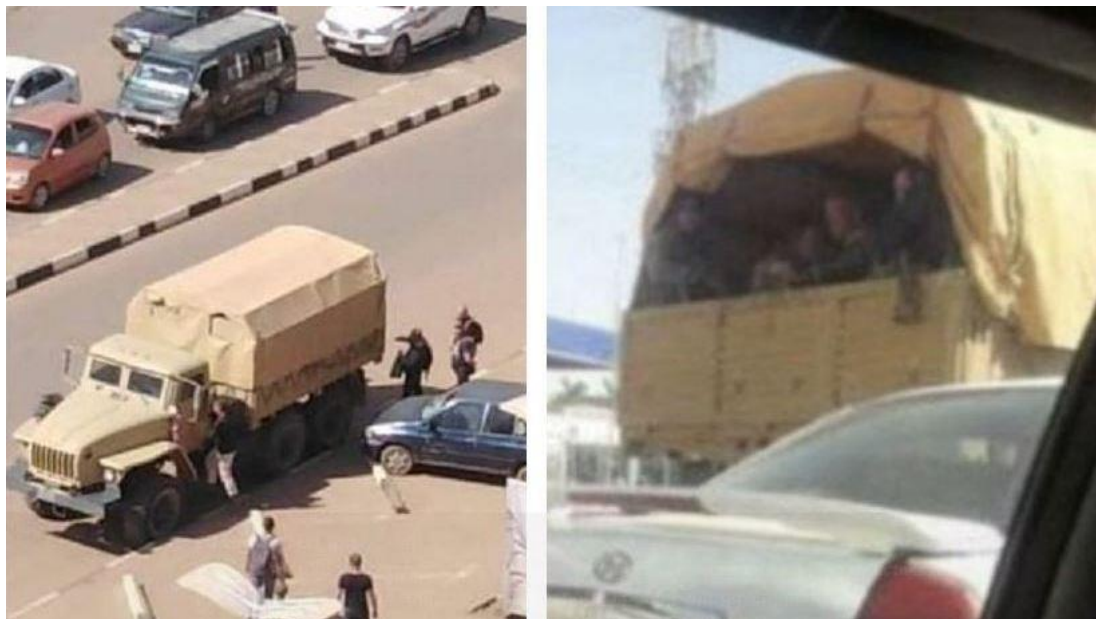
Figura 1. Presencia de presuntos mercenarios rusos en Jartum el 31 de diciembre de 2018.

campañas de información para mejorar la decreciente popularidad del régimen, a la par que Wagner envió más personal al país y entrenó a unidades del servicio de inteligencia sudanés 20 . No obstante, cuando se produjo el cambio de Gobierno, al-Burhan se mostró como un socio fiable para el Kremlin que estaba dispuesto a respetar los acuerdos previos y a mantener la presencia de Wagner y su entramado de explotación y venta de oro. A cambio de su cooperación, las campañas rusas de información en Sudán se aseguraron de ensalzar la imagen de al-Burhan y su «carácter democrático».