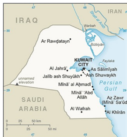
Figura 1. Kuwait

Mientras tanto, Kuwait es un Estado que tiene salida exclusivamente al golfo Pérsico, con 499 kilómetros de área costera, un espacio marítimo de importancia global que comparte con otras siete potencias ribereñas (Baréin, Irán, Irak, Omán, Catar, Arabia Saudita y EAU) entre las que Irak tiene la parte más pequeña, de 58 km, e Irán, la mayor línea de costa con más de 1.000 kilómetros.