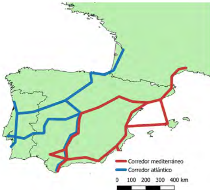
Figura 1. Los grandes corredores europeos en la península ibérica.

El diseño peninsular del corredor atlántico dibuja tres ejes: el que recorre Portugal de sur a norte y se adentra en Francia por el norte de España (Sines-Lisboa-Aveiro-Oporto-Valladolid-Vitoria-Bilbao-Burdeos); aquel que partiendo del puerto de Sines se dirige a Madrid para, desde ese punto, conectar con el norte peninsular (Sines-Madrid-Valladolid-Vitoria-Bilbao-Burdeos), y, finalmente, el que partiendo del sur de España la recorre meridionalmente hasta Valladolid para, desde allí, conectar con Francia (Algeciras-Antequera-Madrid-Valladolid-Vitoria-Bilbao-Burdeos) 11 . En 2019 el Ministerio de Fomento elaboró una propuesta de modificación de este corredor consistente en la incorporación de nuevos nodos con una especial incidencia en las conexiones con los puertos (Gijón, A Coruña, Huelva, Las Palmas de Gran Canaria, Santa Cruz de Tenerife). La entidad pública Administrador de Infraestructuras Ferroviarias (Adif) ha realizado una propuesta consistente