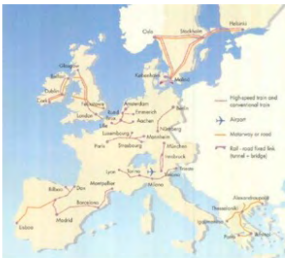
Mapa de prioridades para las redes transeuropeas aprobado en el Consejo Europeo de Essen de 1994

En estas reuniones se aprobaron veinticuatro proyectos prioritarios de conexiones transfronterizas 4 . Catorce de ellos eran de transportes y diez, de energía. La travesía central del Pirineo no solo no apareció en el documento definitivo aprobado, sino que tampoco estuvo en ninguno de los borradores que manejaron la Comisión Europea y los países miembros para el documento finalmente aprobado en 1994.