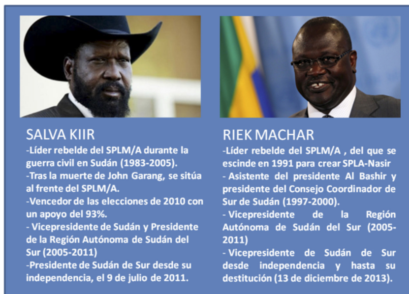
Figura 2. Trayectoria de los líderes Salva Kiir y Riek Machar.

La destitución de Machar, junto con de la detención de 11 opositores a Salva Kiir, se convirtió, de forma extremadamente convulsa y rápida, en el detonante de un conflicto que ahoga a la población sursudanesa en la violencia y el caos más absoluto; y, más importante aún, en la clara constatación de lo extremadamente difícil que resulta convertir a antiguos rebeldes en dirigentes nacionales 7 , siempre más tendentes –como demuestra esta guerra fratricida– a enarbolar el poder de las armas para imponer su voluntad que a comprometerse en el diálogo y el debate político para gobernar democrática y pacíficamente a su pueblo.