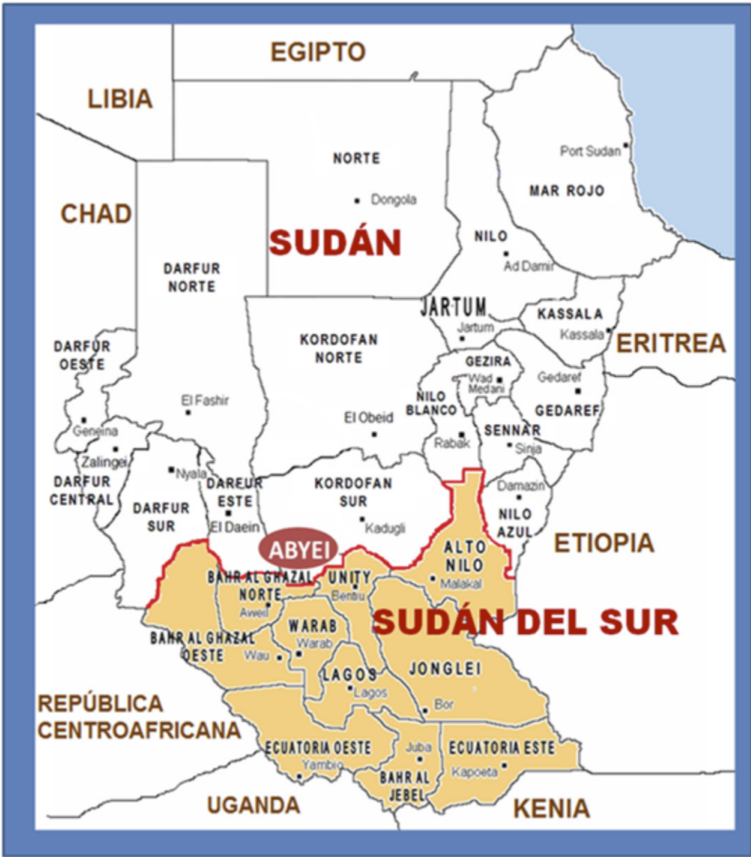
Figura 1. División administrativa Sudán y Sudán del Sur tras la independencia en 2011.

a partir de los noventa, por el descubrimiento y la explotación de petróleo: el mayor sustento de la riqueza sudanesa –nunca distribuida entre la población–, pero también un motivo permanente de enfrentamiento, que aún persiste en la actualidad entre los dos países vecinos. En 2005, el Acuerdo General de Paz 4 (CPA 2005, por sus siglas en inglés), auspiciado y exigido por la comunidad internacional, supuso el inicio de la resolución del conflicto, que concluyó con un referéndum en Sudán del Sur en enero de 2011; entonces, la población se decantó de forma inequívoca (casi el 99% de los sufragios) por la independencia.