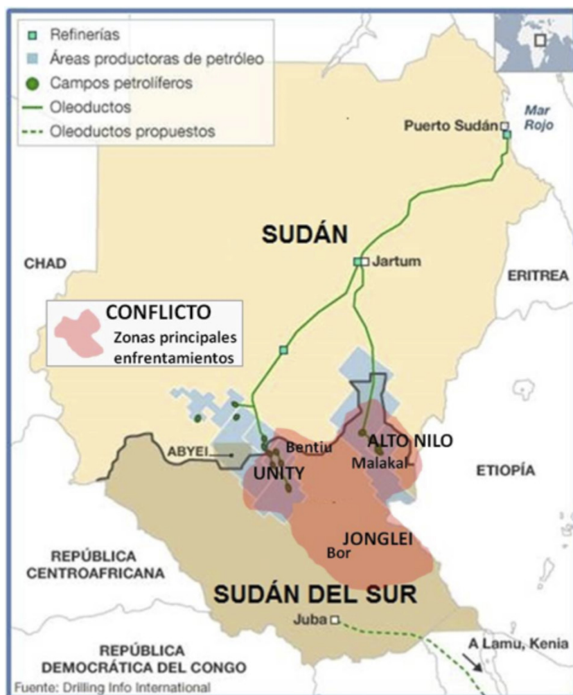
Figura 3. El petróleo, factor fundamental del conflicto.

Y, coincidiendo con este momento de tensión, se produjo también la escisión interna dentro del SPLA, formado por distintas milicias no cohesionadas: muchos militares desertaron para unirse a las tropas antiguubernamentales, renombradas como SPLA en la Oposición (SPLA/IO); o para formar otras facciones rebeldes, entre ellas, el sanguinario «Ejército Blanco». Durante el mes de diciembre, las ciudades de Bor (Jonglei), Malakal (Alto Nilo) y Bentiu (Unidad) se convirtieron en los principales escenarios de conflicto, y fueron cayendo sucesivamente en manos de los dos bandos enfrentados, lo que provocó su total devastación y obligó a cientos de miles de sursudanés a abandonar sus hogares. Muchos de ellos solo encontraron un precario asilo en las bases de la Misión de Naciones en Sudán del Sur (UNMISS), que despliega en el país desde 2011.