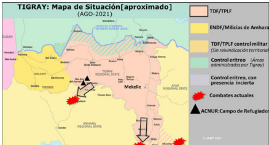
Figura 7.3: Mapa de Situación (AGO-2021). Elaboración propia sobre datos de PolGeoNow

El 23 de julio, el TPLF respondió adentrándose en las regiones vecinas de Amhara (al sur) y Afar (al este) (Figura 7.2.), desplazando a más de 54 000 personas; Afar alberga la carretera principal y el ferrocarril que une Addis Abeba con el puerto de la vecina Yibuti.