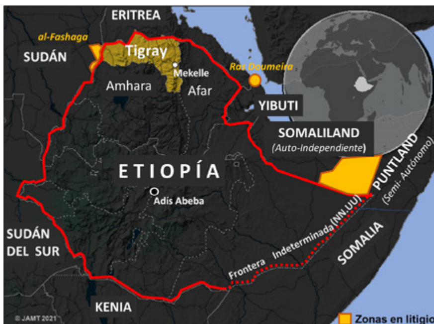
Figura 7.2: mapa de Etiopía: Ubicación de Tigray. Elaboración propia

A partir del 2015, debido al enorme malestar social, se sucedieron una serie de protestas y revueltas, encabezadas por la etnia mayoritaria oromo . La hegemonía del EPRDF duró hasta el nombramiento en 2018 del primer ministro Abiy Ahmed, primer oromo en acceder al cargo, que inició un proceso de transición democrática y apertura, con reformas políticas y económicas. Estas reformas no consiguieron acabar con las divisiones y la violencia étnica que, de hecho, han aumentado y provocado que Etiopía se encuentre actualmente sumida en una grave crisis 9 .