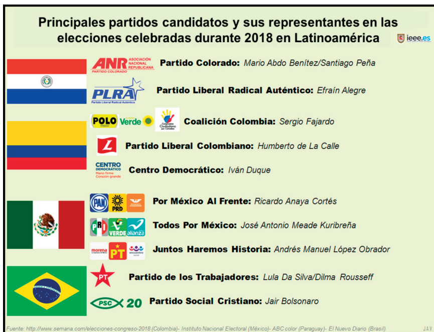
Imagen 2: Principales partidos candidatos y sus representantes en las elecciones celebradas durante 2018 en Latinoamérica.

Finalmente, a finales de 2018 deberían celebrarse las presidenciales en Venezuela, donde Maduro intentará revalidar un nuevo mandato. Dada la envergadura de la crisis venezolana, no debería descartarse ningún escenario,