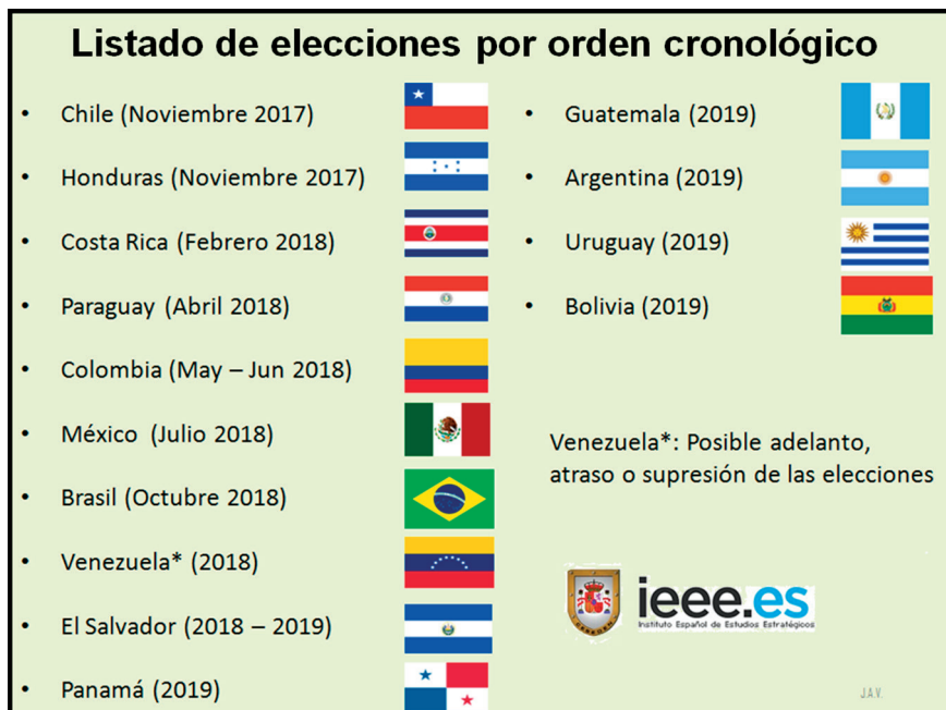
Imagen 1: Listado de elecciones por orden cronológico.

Del resultado de todos estos comicios dependerá no solo el rumbo político de cada país implicado, sino también el del conjunto del continente, dada la densidad de los alineamientos que puedan formarse en una u otra dirección. Si en la primera década del siglo XXI el llamado giro a la izquierda allanó el despegue bolivariano , el triunfo de un número importante de opciones de centro o de centro derecha, especialmente en los países más relevantes, permitirá alcanzar nuevos consensos en política internacional, algunos decisivos a nivel regional.