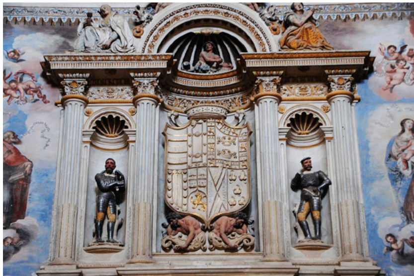
Lansquenets, Tumba del Gran Capitán (Monasterio de San Jerónimo, Granada).