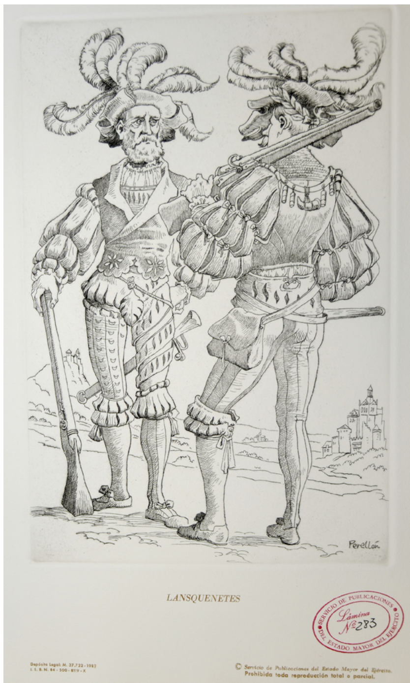
Celedonio Perellón, Lansquenetes (Estampas Militares, Madrid 1982).