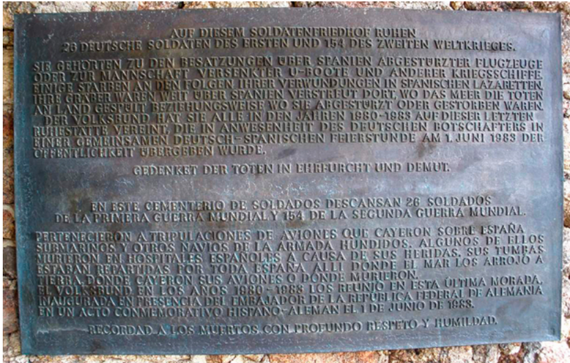
Cementerio militar alemán, inscripción. (Cuacos de Yuste, Cáceres).

«comando W», especial de la Legión Cóndor» 51 . La operación se mantenía en secreto: