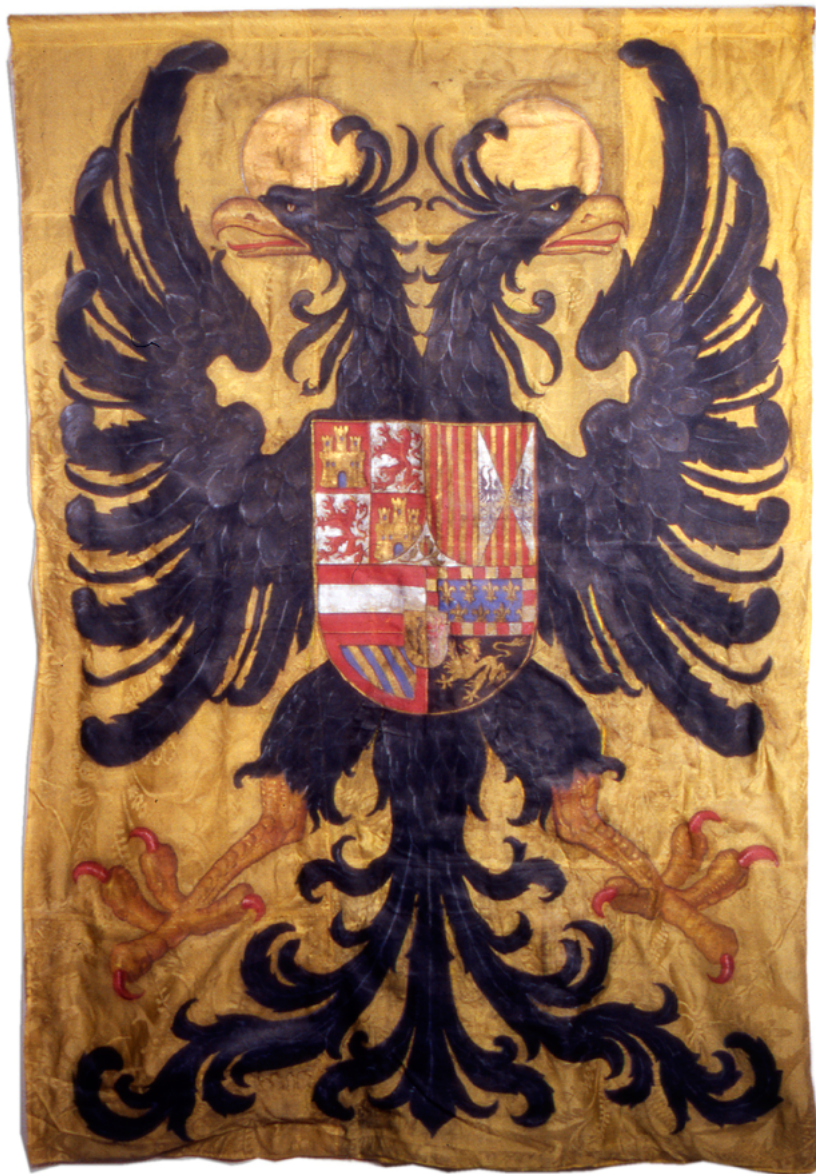
Bandera de Infantería de Carlos V. (Museo del Ejército, Toledo).

por Napoleón Bonaparte, aunque sus sucesores se siguieron intitulado emperadores hasta 1918, cuando los imperios austrohúngaro y alemán fueron abolidos. A partir de esa fecha nosotros seguiremos estudiando a estos soldados como germanos, aunque algunos ya eran austriacos y otros alemanes.