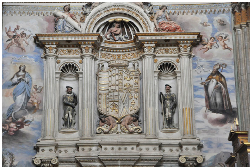
Lansquenetes, Tumba del Gran Capitán (Monasterio de San Jerónimo, Granada).

tenía una posición clave al controlar los pasos de los Alpes ya que estos constituían la vía de comunicación más importante entre Italia y el norte. Se trataba no solo del camino más cómodo, sino también del más seguro. Las vías de comunicación desde Milán a través del territorio de los Grisones o los territorios de la Confederación Suiza, o a través de Saboya hacia el norte, pasaban por pasos de mayor altitud y en parte atravesaban territorios protestantes y, en el caso de Saboya, muy cerca de la frontera francesa. El camino a través del Tirol era más largo pero, de cualquier modo, mucho más seguro que las rutas anteriormente mencionadas. A esto hay que añadir que el archiduque Fernando controlaba en Suabia zonas muy importantes por ser posesiones austriacas. No olvidemos que así era un vecino de los españoles en Alsacia. Y, finalmente, la mayor parte de los lansquenetes que debían servir en Italia eran reclutados en el Tirol y en Baviera, debido a que en estos territorios imperiales se podía garantizar que los lansquenetes eran católicos 62 .