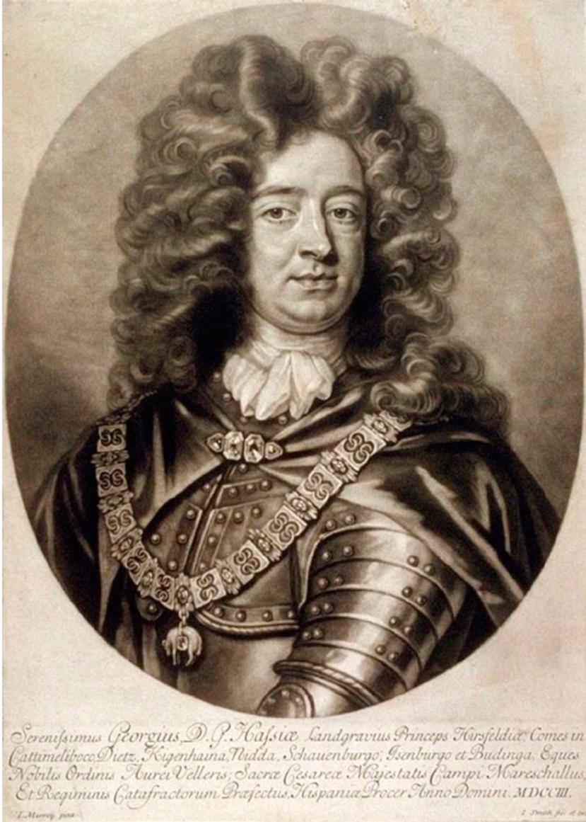
John Smith, Georg de Hessen-Darmstadt. (Fine Arts Museum of San Francisco online).

propugnaba el Almirante de Castilla se descartó porque no se podía contar con ningún apoyo local 12 . Siempre en correspondencia con los intereses ingleses, el nuevo punto de mira fue Gibraltar, la puerta hacia el Medite-