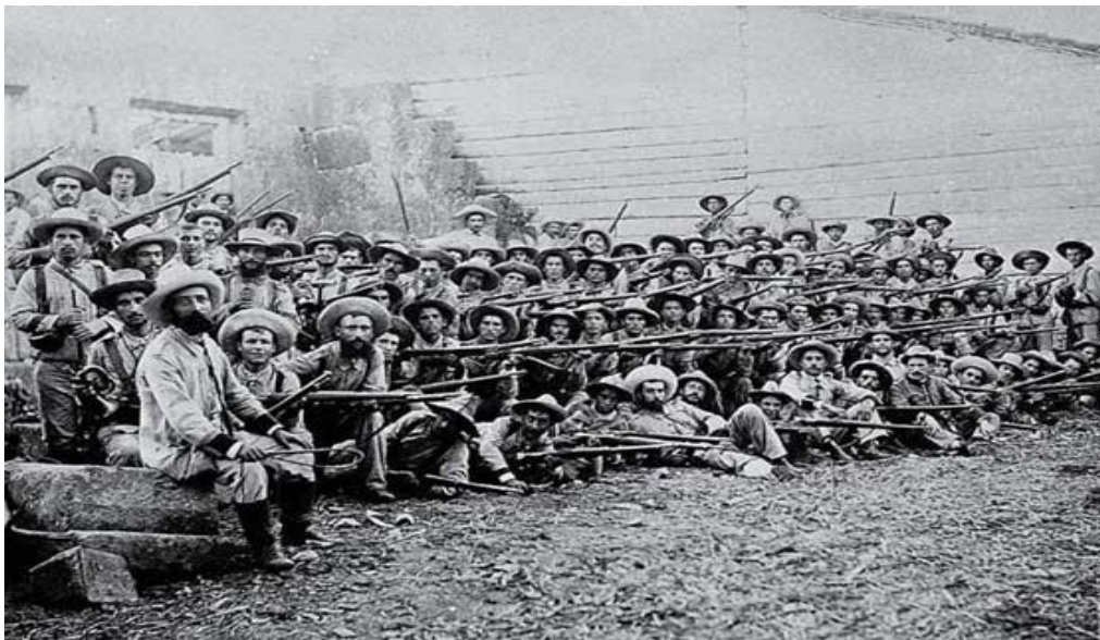
Soldados españoles en Cuba

https://senderosdelahistoria.wordpress.com/2017/07/14/el-desastre-del-98-la-guerra-entre-eeuu-y-espana/