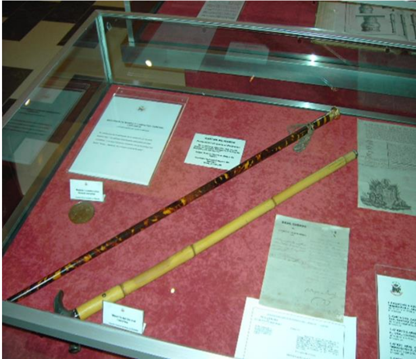
Bastones del general Castaños