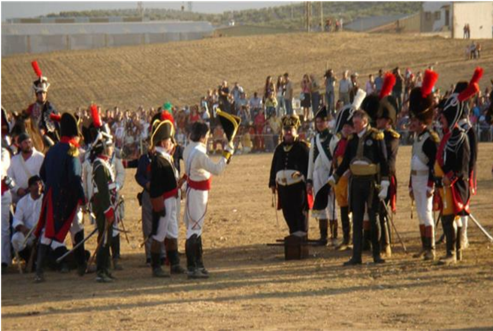
Recreación histórica de la Batalla de Bailén

http://bailendiario.com/tag/recreacion-historica-de-la-batalla-de-bailen/