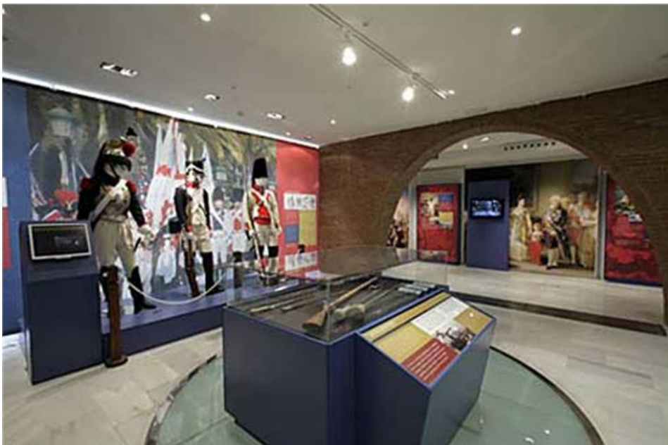
Vista general del Centro de Interpretación de la Batalla de Bailén en Bailén

http://www.bailendigital.com/local/totalmente-renovado-el-centro-de-interpretacion-de-la-batalla-de-bailen-asume-que-la-batalla-de-baecula-fue-en-santo-tome