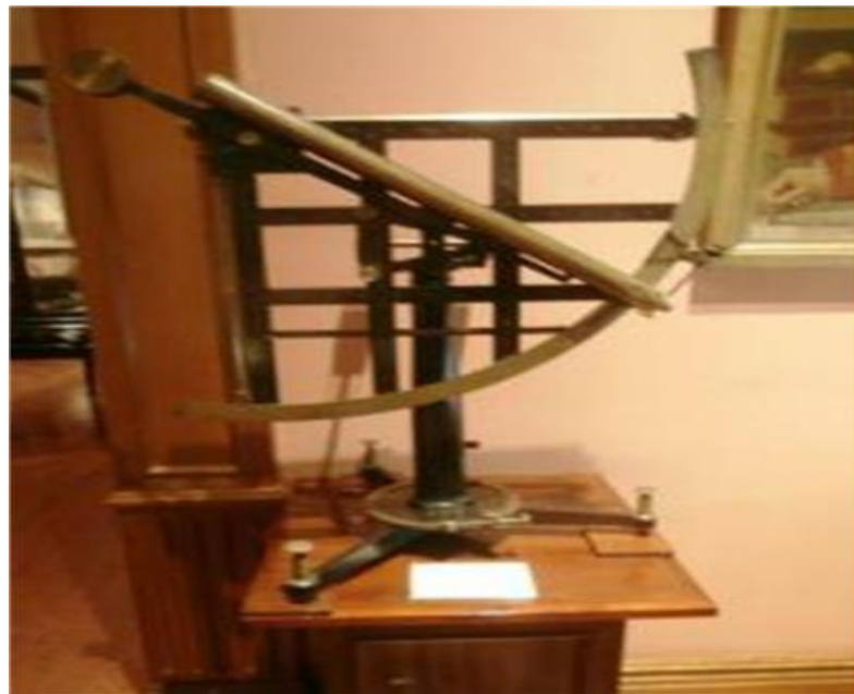
Cuadrante Acimutal del siglo XVIII, en el Museo Naval de Madrid