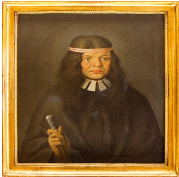
Retrato de Catiguala, cacique de los indios huiliches (Chile), por José del Pozo, en el Museo Naval de Madrid.

https://cvc.cervantes.es/actcult/museo_naval/sala8/personajes/personaje_03.htm