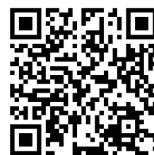
Toda la información sobre el DIFAS