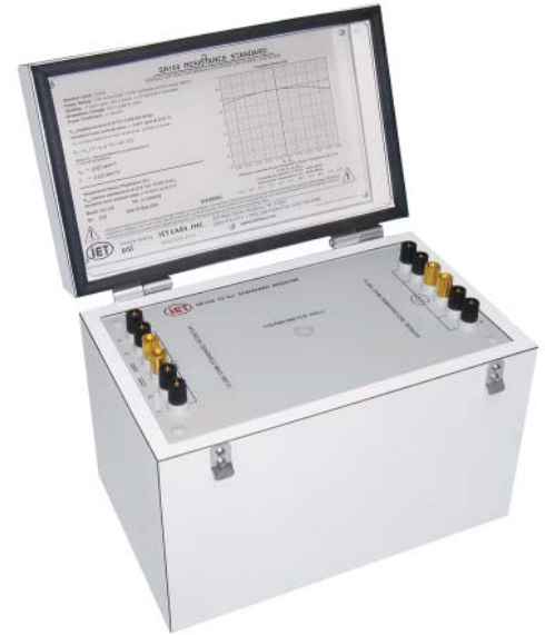
Transportable Resistance Standard