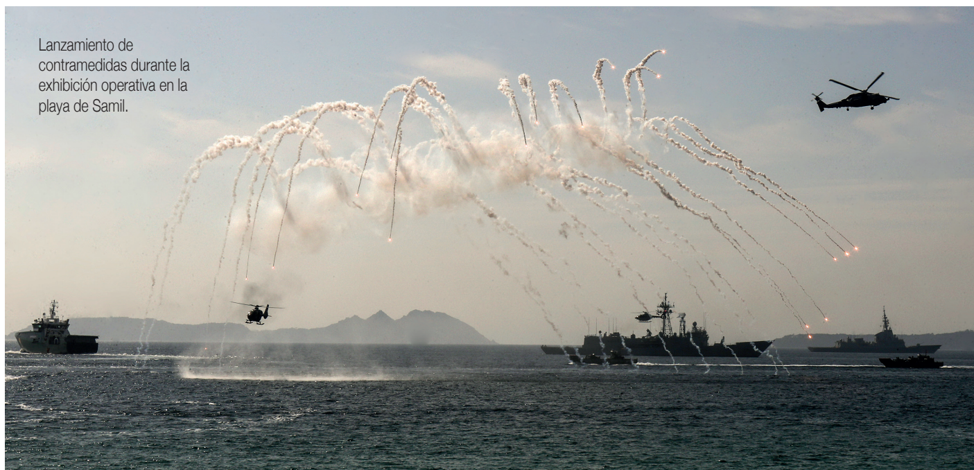
Lanzamiento de contramedidas durante la exhibición operativa en la playa de Samil.

pacidades del robot de reconocimiento y desactivación Avenger ; la recogida de un agente químico y el paso por una estación de descontaminación; el rescate de una persona accidentada en una zona de difícil acceso, mal iluminada y húmeda; el paso de una pista de obstáculo de diferentes perros especializados en búsqueda de personas; el rescate de una persona mediante el NH90 Lobo , uno de los helicópteros militares más avanzados y una demostración de las capacidades de la Fuerza de Protección de la Armada y la flotilla de aeronaves.