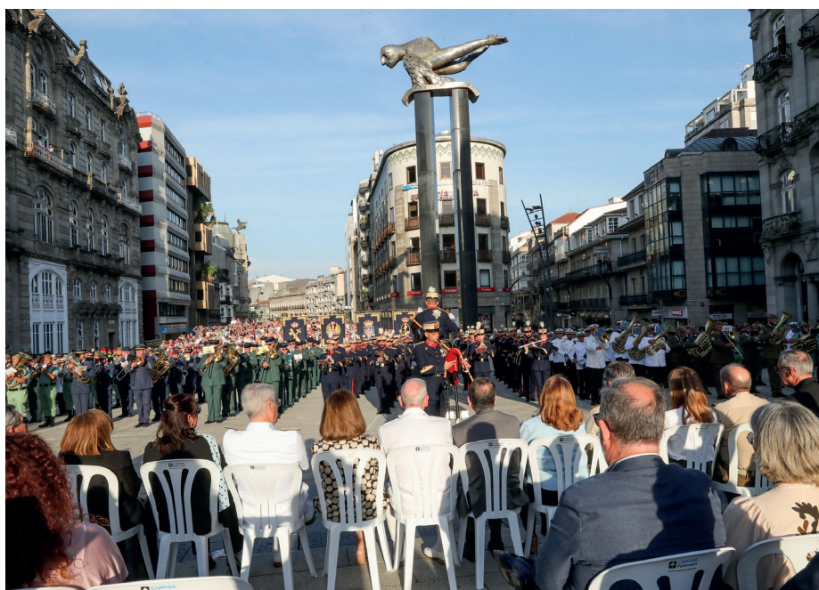
En la plaza Porta do Sol se celebró un encuentro de músicas militares presidido por el JEMAD que contó con la participación de siete unidades y bandas.

de la Brigada Galicia VII. Quizás porque es una de las unidades más conocidas en la zona al tener su cuartel general en la misma provincia, concretamente en Figueirido; quizás porque a la puerta estaba su mascota, un águila Harris de nombre Galicia. Estaba muy tranquila con su adiestradora, como si la presencia de tanta gente a su alrededor fuera lo más habitual en su día a día.