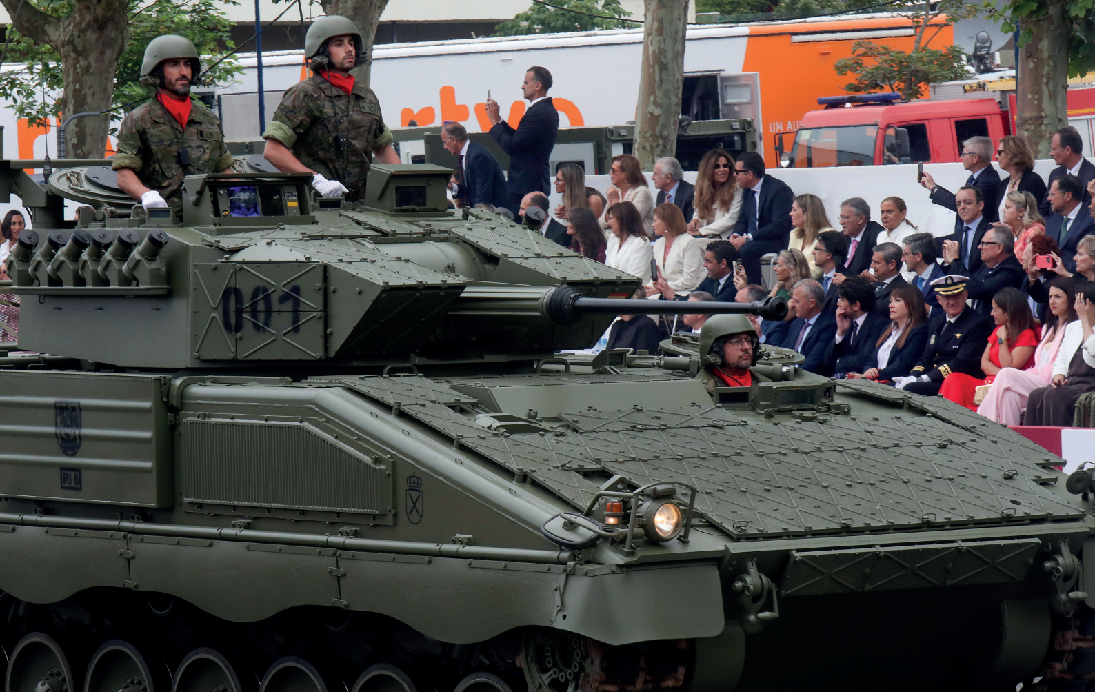
Un vehículo Pizarro a su paso por delante de la tribuna. Debajo, alumnos de la AGA preceden el desfile del Escuadrón de Zapadores Paracaidistas.

E L 30 de mayo, Vigo amaneció muy nublado. Eso no impidió que miles de personas se apostaran a lo largo de la avenida de Samil desde primera hora —algunas aseguraban haber llegado a las cuatro de la madrugada— para conseguir el mejor lugar para ver a los Reyes y a la Princesa Leonor quien, por primera vez, participaba en el acto central del Día de las Fuerzas Armadas. Y, sobre todo, para disfrutar de un desfile en el que estaba previsto que tomaran parte 3.266 militares, 30 aeronaves de caza, 14 de transporte, 25 helicópteros, 109 vehículos y 32 motos. Era el día grande de una semana dedicada a mostrar a la población el trabajo y las capacidades de los ejércitos, de mostrar cómo se preparan para cumplir con su trabajo de servicio a la sociedad. Lo hicieron mediante exposiciones de material, demostraciones operativas, exhibiciones dinámicas, conciertos de música militar y una parada naval en la que participaron nueve buques de la Armada y de la Guardia Civil, algunos de los cuales se abrieron al público. Era la primera vez que estos actos se celebraban en Vigo, la cuarta en Galicia, y la población se volcó con sus Fuerzas Armadas.