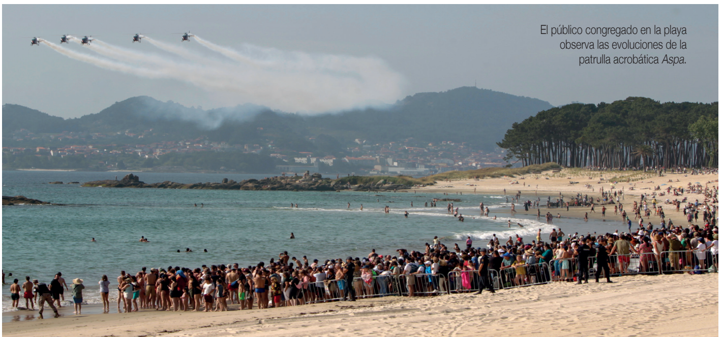
El público congregado en la playa observa las evoluciones de la patrulla acrobática Aspa.