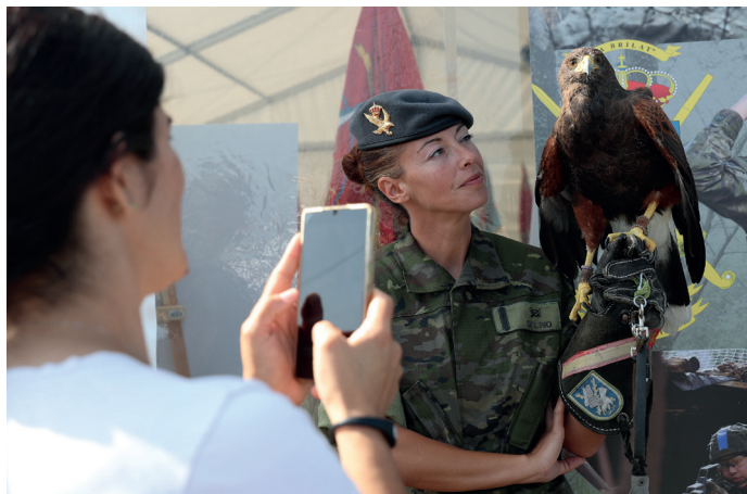
La mascota de la Brilat, un águila Harris de nombre Galicia, acaparó el interés de muchos de los visitantes a la exposición.