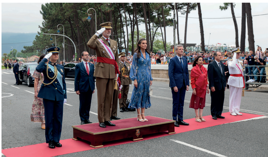
Los Reyes, la Princesa de Asturias y las autoridades escuchan el Himno Nacional en la Avenida de Samil.