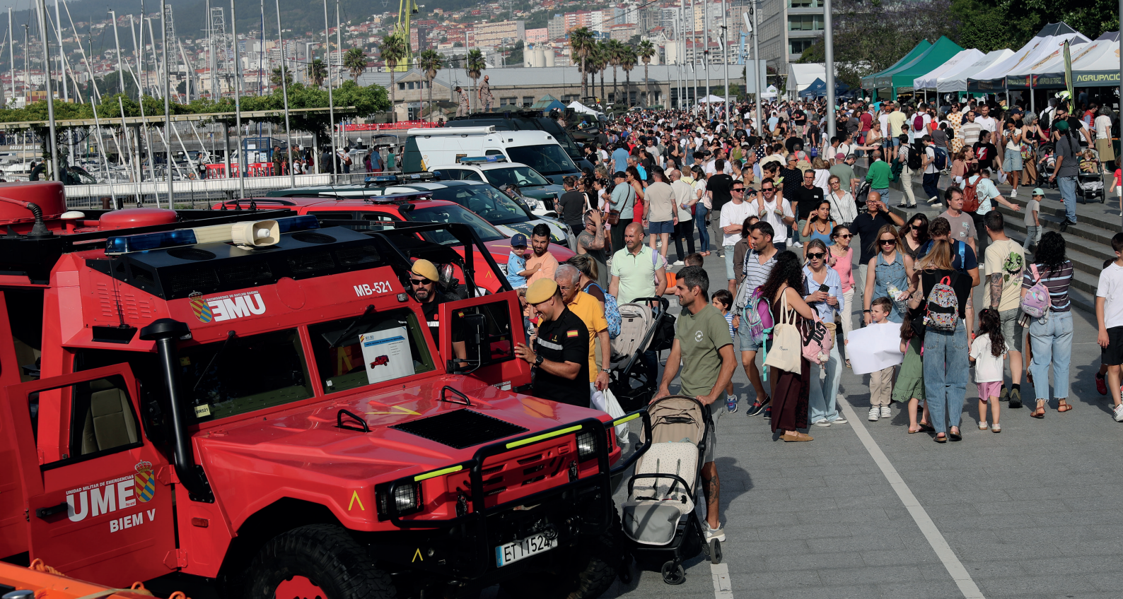
A la zona del puerto donde se instaló la exposición estática acudió numeroso público para conocer de cerca el material militar.