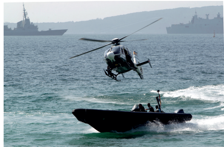
Un Harrier de la Armada en suspensión sobre el agua. Arriba un helicóptero de la Guardia Civil persigue a una lancha rápida de narcotraficantes. Debajo, demostración operativa del Ejército de Tierra sobre la arena.