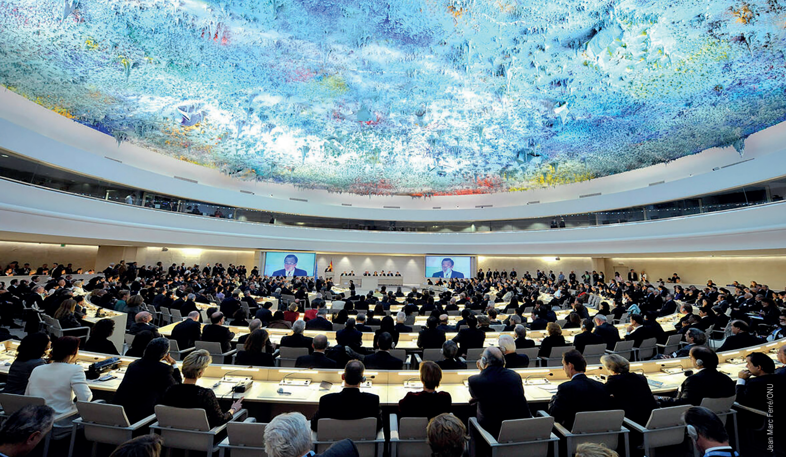
Jean Marc Ferré/ONU

situaciones de violaciones de los derechos humanos y formular recomendaciones sobre todas las cuestiones relativas a los derechos humanos. Actúa de forma permanente y tiene su sede en la Oficina de las Naciones Unidas en Ginebra. El Consejo está integrado por 47 Estados miembros, que son elegidos por la mayoría de los miembros de la Asamblea General de las Naciones Unidas a través de votación directa y secreta. La Asamblea General tiene en cuenta la contribución de los Estados candidatos a la promoción y protección de los derechos humanos, así como las promesas y compromisos, en este sentido voluntarios.