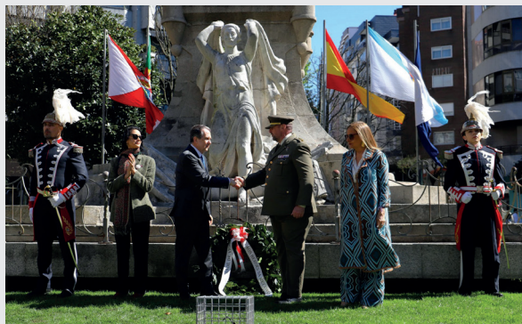
El alcalde y el subdelegado de Defensa en el homenaje a los Héroes de la Reconquista, el pasado 28 de marzo.

VIGO no se entiende solo desde su perfil industrial o pesquero. Detrás de esa imagen tan reconocible hay, además, una conexión profunda y estratégica con las Fuerzas Armadas españolas, forjada a lo largo de siglos y marcada, sobre todo, por su posición privilegiada como puerta atlántica de Europa. Su ría, amplia y protegida, ha sido un enclave natural de enorme valor militar desde mucho antes de que la ciudad alcanzara su actual relevancia.