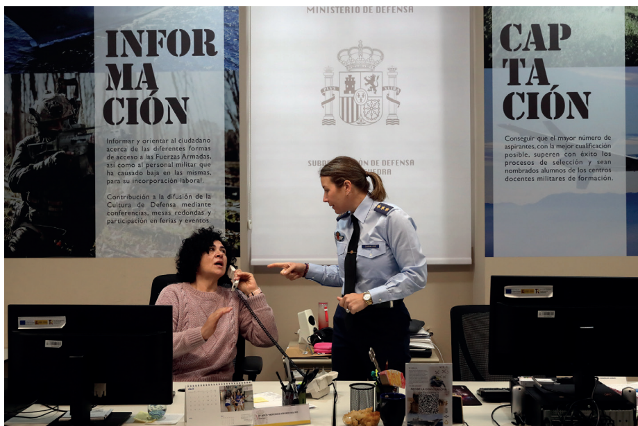
En el área de reclutamiento de la Subdelegación de Defensa de Pontevedra trabajan nueve militares, a los que se suman reservistas voluntarios.

La Armada mantiene una importante presencia marítima en el litoral de la comunidad autónoma. En Ferrol tienen su base las fragatas de la 31ª Escuadrilla de Escoltas, los buques de aprovisionamiento y los patrulleros de la Flota. También, la Fuerza de Acción Marítima —con sus