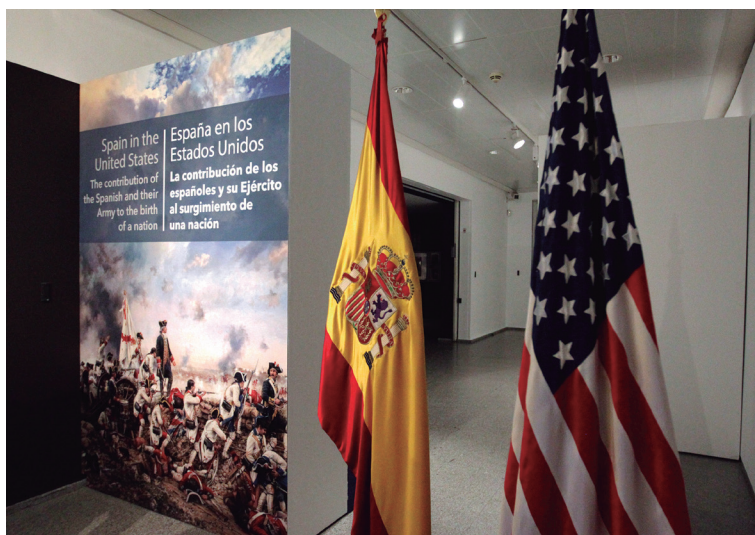
Las banderas de España y Estados Unidos presiden la entrada a la exposición sobre la ayuda hispana al nuevo país americano junto al cartel de la misma.

Tras cruzar el umbral de la exposición, el visitante se encuentra con un audiovisual que presentan a algunos de los