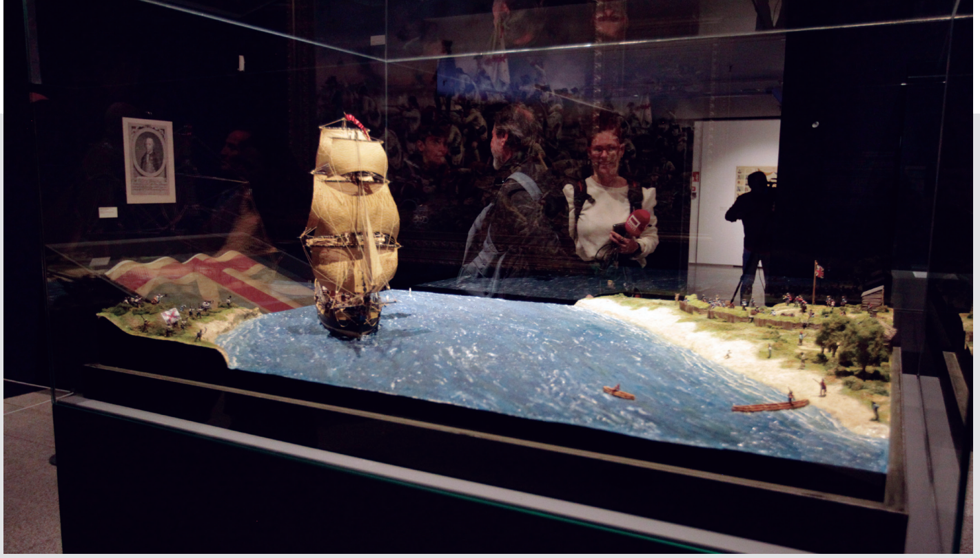
Vista parcial del espacio dedicado al general español Bernardo de Gálvez que incluye un diorama de la batalla de Pensacola, victoria que fue clave para el Ejército Continental de G. Washington en su lucha contra la Corona Británica.