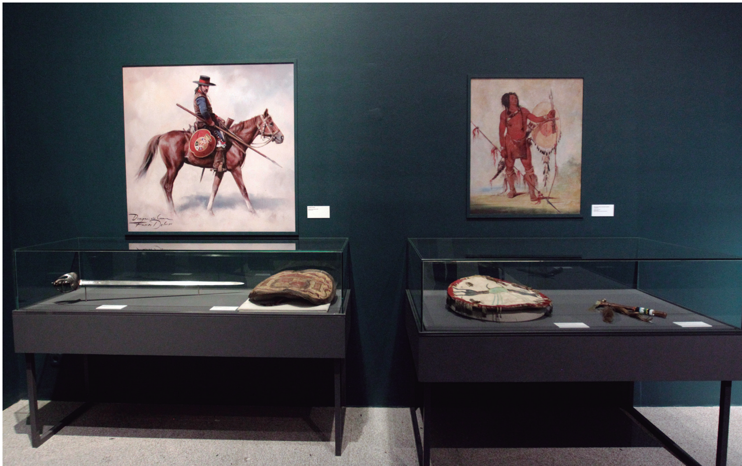
A la izquierda, espada de dragones y adarga (escudo) de soldado de cuera o presidial, fuerzas españolas de la frontera norteamericana; a la derecha, rodela o chimal (escudo) apache y tomahawk-pipa .

muchos exploradores, marinos y militares —seguidos y/o acompañados por religiosos y colonos— que apostaron por internarse en tierras ignotas con afán de aventura, fama y riqueza, pero, también de compromiso, servicio al rey e integrar en su cultura a los habitantes locales.