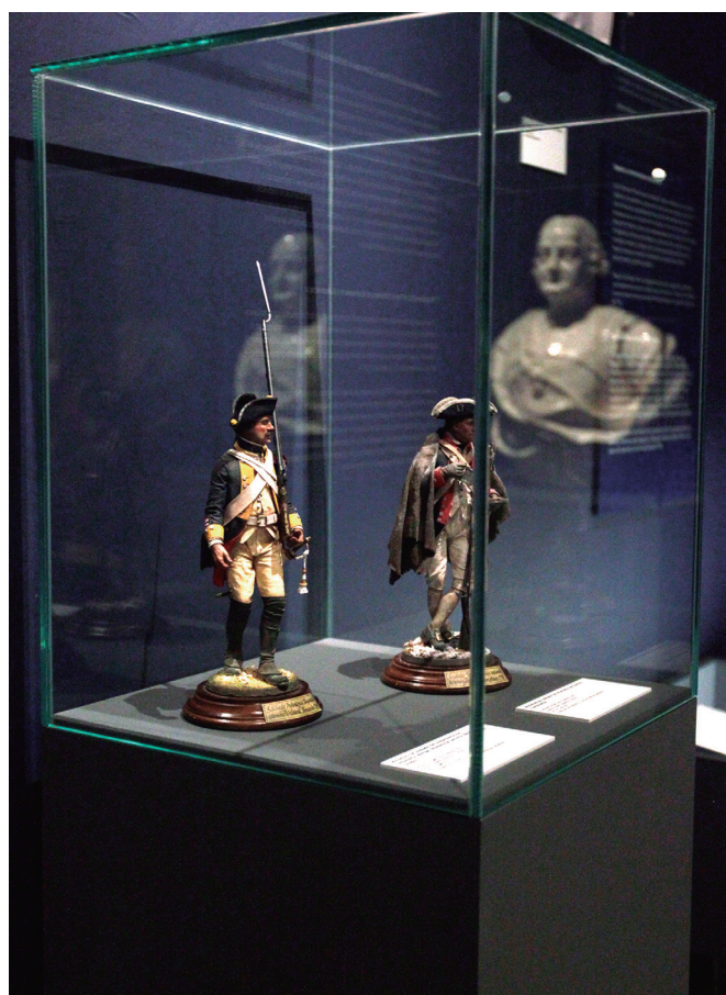
Soldados de infantería del regimiento alemán Waldelck , al servicio de Reino Unido, y del Ejército Continental de G. Washington; y reflejo del busto del conde de Aranda.

Por ejemplo, el Real Arsenal de La Habana (Cuba), fundamentalmente en el siglo XVIII, aplicó en sus construcciones navales sistemas que incrementaban la potencia de fuego sin mermar la navegabilidad, cuestión esencial para proteger barcos y territorios.