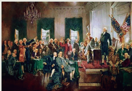
Tratado de Amistad, Límites y Navegación (...) de 1796 entre España y Estados Unidos y firma de su Constitución (H. Chandler), marcada por el ideario de Jefferson.

Gálvez, uno de los nombres destacados en ambos capítulos.