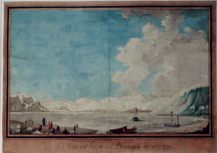
Puerto Desengaño (hoy, Alaska) en 1791; debajo, rincón dedicado a los presidios, fuertes que velaban por la seguridad en la frontera novohispana con pequeñas guarniciones, a través de documentos sobre el Nuestra Sra. del Pilar y San Sabá .