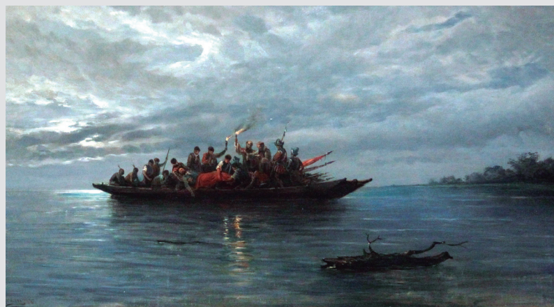
Retratos de Carlos III y Gálvez, ambos del pintor de la corte Maella, y bandera original de un batallón de infantería británica capturada por el general español en 1781; debajo, cuadros de Cabeza de Vaca (Usabal), Avilés —al fondo— y el «paseo» de Coronado por Arizona (1540), obra de Ferrer-Dalmau; a la derecha, pintura de R. Monleón recordando el entierro de Hernando de Soto en el Misisipi, río que descubrió.