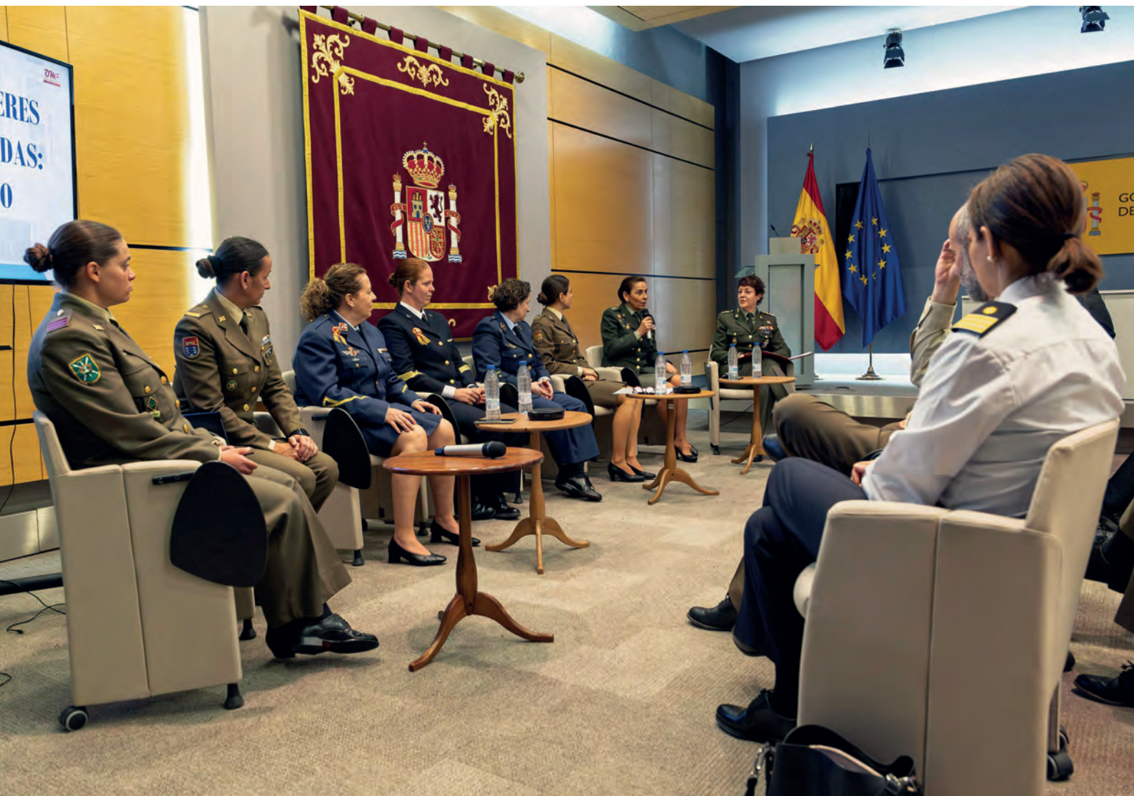
Militares de los Ejércitos, la Armada y los Cuerpos Comunes, durante el encuentro celebrado el 10 de abril en la sede del Ministerio de Defensa.

Varias profesionales exponen sus experiencias personales y su visión del proceso por la igualdad en las Fuerzas Armadas