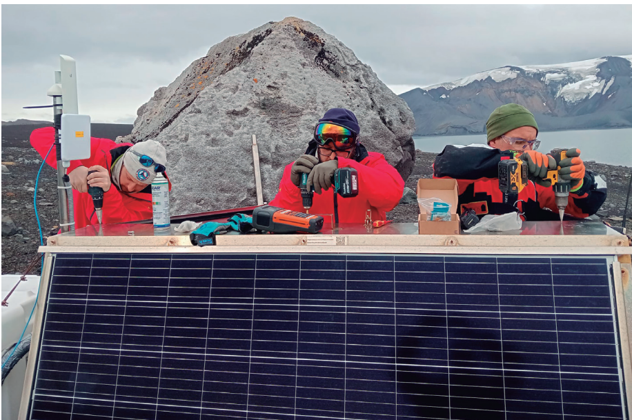
Instalación de las infraestructuras necesarias para una estación meteorológica, destinada a la medición de presión, humedad y temperatura, cerca del refugio chileno de la Antártida.

A partir de ahí, su trabajo se centró en facilitar el de los investigadores, dándoles seguridad y acompañándolos en sus desplazamientos por la isla. En los tres meses que ha durado la campaña, han desarrollado seis proyectos científicos financiados, en su mayoría, por el Ministerio de Ciencia e Innovación, que también contribuye al sostenimiento de la logística y las instala-