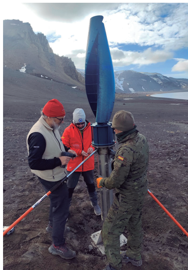
Instalación de un aerogenerador en Fumarolas. A la izquierda, transporte de material a través de isla Decepción para poder desarrollar los estudios científicos previstos.