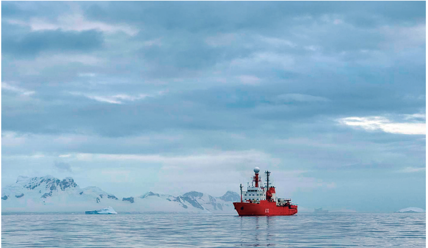
El BIO Hespérides ha atravesado ocho veces el mar de Hoces para transportar al personal militar y científico que ha desarrollado su trabajo en las dos bases antárticas españolas —la Juan Carlos I y la Gabriel de Castilla —, así como el material y los víveres que han necesitado durante tres meses.

la dinámica de fluidos, la interacción con el fondo marino y los ecosistemas para medir el impacto del calentamiento global.