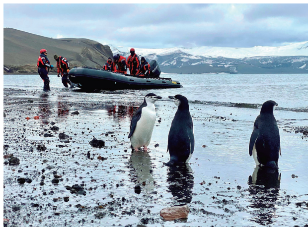
Científicos y militares llegan en una lancha para implementar un nuevo sistema de comunicaciones en las estaciones de vigilancia del IGN.

En la Campaña Antártica Española 2025-2026, el Hespérides ha cruzado ocho veces uno de los pasos más peligrosos del planeta: el mar de Hoces, también conocido como Paso Drake. «España siempre ha defendido la primera de estas denominaciones, porque fue el marino y explorador español Francisco de Hoces el que lo navegó por primera vez», asegura el comandante del Hespérides . Precisamente, este año se conmemora el 500º aniversario de este acontecimiento histórico y nuestro país ha logrado que la Organización Hidrográfica Antártica Internacional lo reconozca como nombre oficial. De hecho, Argentina y Chile van a modificar su cartografía para que ya aparezca reflejado como mar de Hoces.