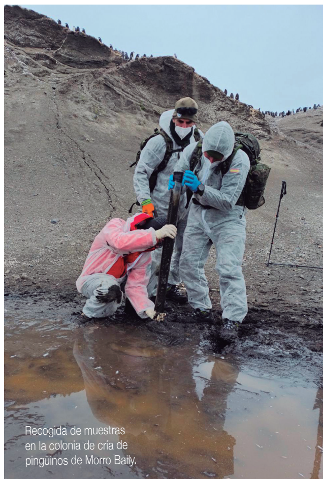
Recogida de muestras en la colonia de cría de pingüinos de Morro Bailly.