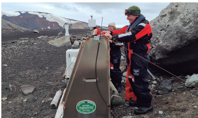
Comprobación de datos sobre el estado del volcán que conforma isla Decepción. Debajo, descarga de vehículos, para su traslado en una pontona hasta la base.

Una de las misiones del contingente destacado en isla Decepción es dar a conocer a la sociedad, en general, y al mundo científico, en particular, las actividades del Ejército de Tierra en la Antártida. Para ello, desde la base Gabriel de Castilla se han