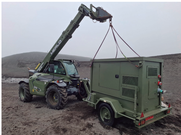
Transporte de uno de los aerogeneradores instalados durante la campaña en la base Gabriel de Castilla .

Los militares destacados en la Gabriel de Castilla también han instalado dos