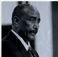
General Abdel Fattah al-Burhan

Graduado en la Academia Militar de Sudán (1991), al-Burhan combatió en el conflicto de Darfur y en la guerra secesionista del sur de Sudán. Fue comandante regional en Darfur, inspector general del Ejército y, en 2018, Al Bashir le nombró comandante de las Fuerzas Terrestres del Ejército. En 2019, en medio de las revueltas sociales, fue elevado al rango de teniente general y nombrado jefe de las Fuerzas Armadas de Sudán. Finalmente, tras decretar el encarcelamiento de Al Bashir y acercarse a los líderes sociales, fue designado presidente del Consejo Soberano de Sudán (gobierno civil-militar de transición). En octubre de 2021 lideró, junto a Hemedti , el golpe militar que acabó con el proceso de transición civil-militar. Desde entonces, es el presidente del Consejo de Soberanía de Transición.