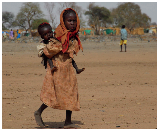
Una niña traslada a su hermana en un campo de refugiados próximo a la frontera con Egipto.

En este contexto, China, trascendental socio comercial y principal financiador de Sudán desde los noventa, se muestra reacia a involucrarse en los esfuerzos de paz, pero intentará trabajar con un nuevo gobierno para preservar la estabilidad y su enorme inversión en infraestructuras sudanesas, especialmente petroleras. Finalmente, Arabia Saudí y