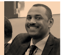
General Mohamed Hamdan Dagalo (Hemedti)

Graduado en la Academia Militar de Sudán (1991), al-Burhan combatió en el conflicto de Darfur y en la guerra secesionista del sur de Sudán. Fue comandante regional en Darfur, inspector general del Ejército y, en 2018, Al Bashir le nombró comandante de las Fuerzas Terrestres del Ejército. En 2019, en medio de las revueltas sociales, fue elevado al rango de teniente general y nombrado jefe de las Fuerzas Armadas de Sudán. Finalmente, tras decretar el encarcelamiento de Al Bashir y acercarse a los líderes sociales, fue designado presidente del Consejo Soberano de Sudán (gobierno civil-militar de transición). En octubre de 2021 lideró, junto a Hemedti , el golpe militar que acabó con el proceso de transición civil-militar. Desde entonces, es el presidente del Consejo de Soberanía de Transición.