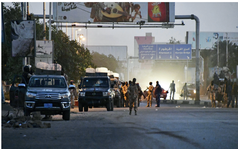
Los conflictos en Jartum han convertido la capital en un caos donde la población intenta escapar del fuego cruzado sin ningún tipo de protección.

Aunque los primeros acuerdos de alto el fuego se gestaron con la mediación de Sudán del Sur, en representación y por encargo de la Autoridad Intergubernamental para el Desarrollo en África Oriental (IGAD); desde el 9 de mayo, la ciudad saudí de