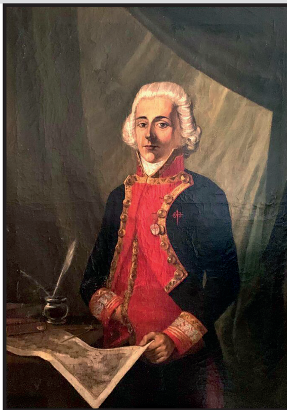
Retrato del brigadier, cedido por la familia al Museo Naval de San Fernando (Cádiz).

El 2 de septiembre, se enfrentó a un gran temporal al doblar el cabo de Hornos y desapareció con sus 644 ocupantes sin que nunca se haya sabido de su suerte con certeza. Fue avistado por última vez en los 62 grados de latitud sur y 70