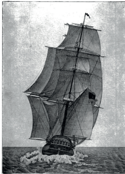
Instituto de Historia y Cultura Naval

El 2 de mayo Madrid se levantó en armas. Comenzó así la Guerra de la Independencia (1808-1814). Desde una óptica global, representó el definitivo cambio español de bando y la extensión del conflicto europeo al teatro de operaciones ibérico.