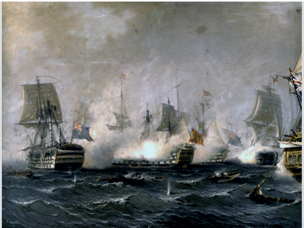
Archivo General de la Marina