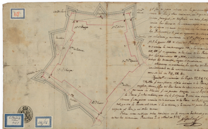
Plaza de Rosas (Archivo Gral. Militar de Madrid) en 1796, poco después de que el marino limeño la evacuara en la Guerra de la Convención.