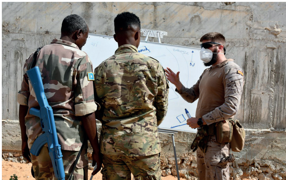
El FEAP, que contará con 5.000 millones de euros para los próximos siete años, garantiza una financiación permanente a los costes comunes de las operaciones.

Gracias al nuevo Fondo, la UE podrá asegurar la provisión de fondos de manera fiable y previsible; permitir una respuesta rápida a las crisis y la provisión de asistencia urgente; y proporcionar apoyo a largo plazo para el desarrollo de capacidades de los socios de la Unión. Otras novedades que aporta el Fondo es que a través de él Europa podrá ayudar de forma bilateral a los países socios en asuntos militares y de defensa, y la colaboración no se limitará a África, sino que amplía su marco geográfico. Por último y por primera vez, la Unión