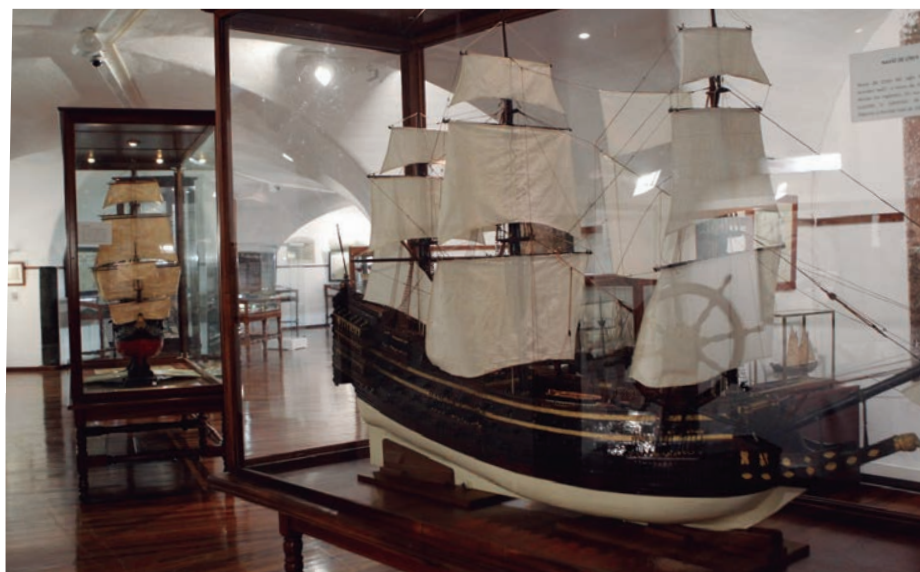
Una de las nuevas salas del Museo Naval de Ferrol recientemente inaugurada. Debajo, buques a escala de la colección militar del Fuerte Almeyda (Tenerife).