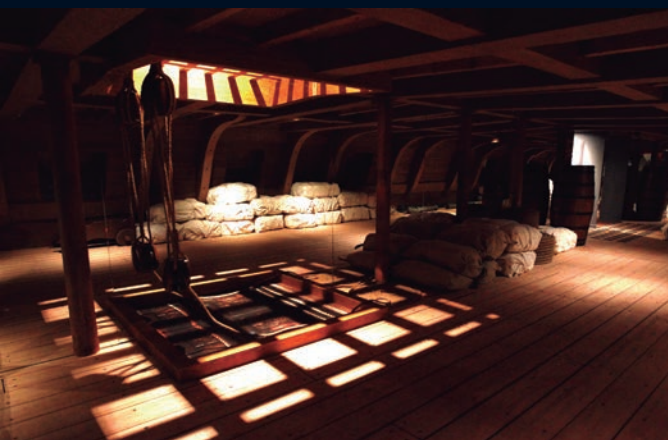
De izquierda a derecha y de arriba a abajo, Museo Naval de Sevilla, labores de restauración en el Militar de Canarias, recreación del entrepuente de un navío expuesta en la colección de la Armada en Ferrol y mural árabe del Museo del Ejército.