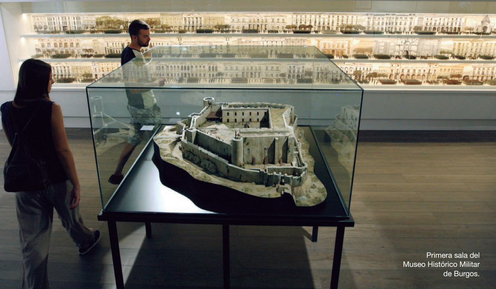
Primera sala del Museo Histórico Militar de Burgos.