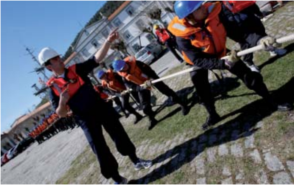
Frente a los edificios de la Escuela los alumnos trabajan duro en su adiestramiento bajo la atenta mirada del personal docente del centro.