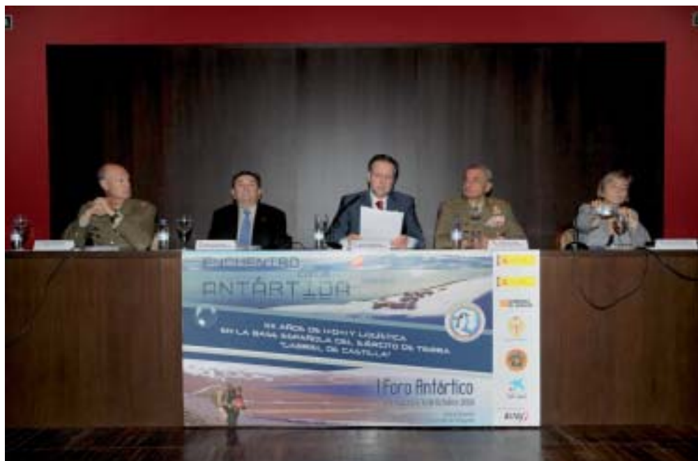
El presidente de Aragón, Marcelino Iglesias (centro) presidió la inauguración junto al general de ejército Fulgencio Coll y el rector de la Universidad de Zaragoza, Manuel José López.

Expertos civiles y militares debaten sobre el futuro de la investigación en el continente helado