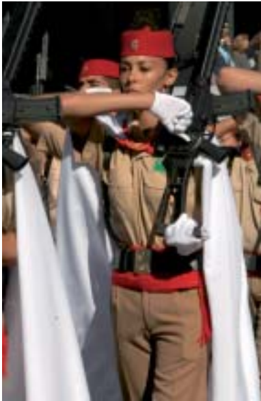
Llegada de la Familia Real a la plaza de Lima. En el desfile participaron vehículos Centauro, legionarios, regulares, alumnos de academias y la patrulla Águila .