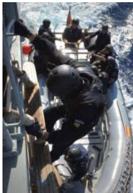
Militares españoles y portugueses interceptan un buque en el golfo de Cádiz.

La Iniciativa 5+5 desarrolla además cuatro proyectos de gran alcance: El Centro Regional de Control Virtual de Tráfico Marítimo, el Colegio 5+5 de Defensa, el Centro Euromagrebí de