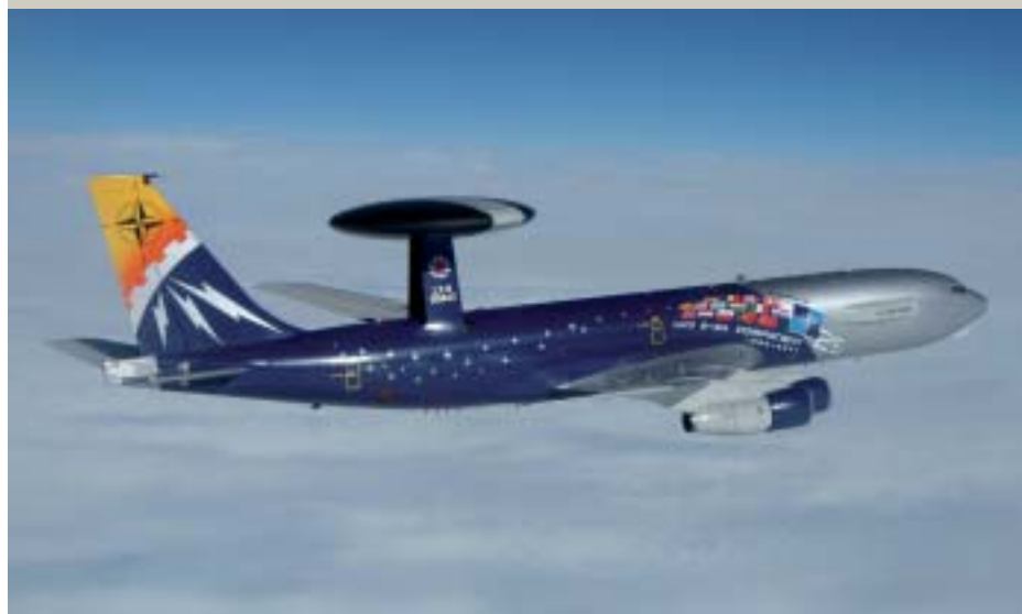
Uno de los aviones de la Fuerza de Alerta Temprana con los colores conmemorativos del vigésimo quinto aniversario de la unidad.

La tripulación se divide en personal de vuelo con dos pilotos, un navegante y un mecánico de vuelo y personal de la misión (un director táctico, un controlador principal de interceptación, dos controladores de interceptación, un controlador de contramedidas, de vigilancia tres operadores de vigilancia, un técnico de comunicaciones, un técnico de radar y un técnico de sistemas. El número total de efectivos a bordo varía según el tipo de misión entre 17 y 29 tripulantes.