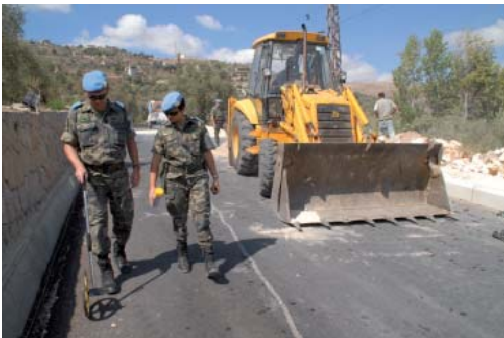
Los integrantes de la unidad CIMIC en el Líbano gestionan y determinan las necesidades de programas de construcción de infraestructuras.

Precisamente, todo lo relativo a la cultura, tradiciones y normas de comportamiento de la población civil que vive en las zonas de despliegue es uno de los aspectos más importantes que centran