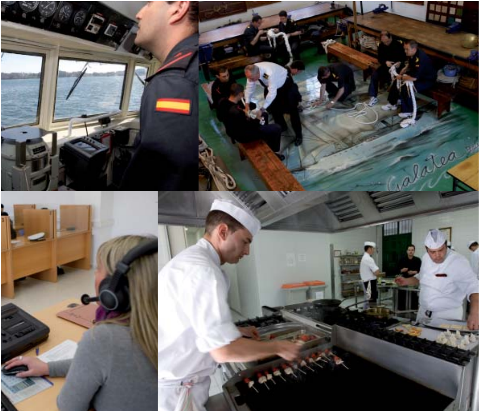
En la ría de Ferrol (arriba a la izda.), o en las aulas (en la foto de administración y de hostelería); donde también hay espacio para mejorar el inglés.

citada Ley establece que la enseñanza de formación de suboficiales, además de la formación militar general y específica, comprenderá la formación técnica correspondiente a un «título de formación profesional de grado superior». Para ello, el centro seguirá las pautas que sobre estas titulaciones marca el Ministerio de Educación. De hecho, dos de los profesores de la ESENGRA forman parte, en representación del Ministerio de Defensa, de los grupos de trabajo organizados por el MEC para la