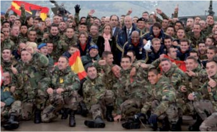
Los soldados del contingente español se fotografiaron con la ministra de Defensa y los jugadores de la selección nacional de fútbol.