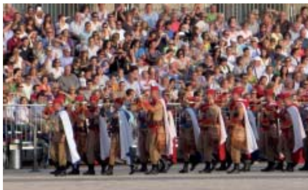
Las gradas, en las que no cabe un alfiler, aplauden las evoluciones de la Nuba de las Fuerzas de Regulares de Melilla num. 52.

El director artístico del festival, general Francisco Grau, hasta el pasado