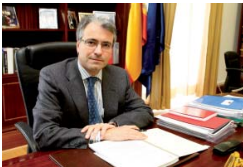
El SEGENPOL explica que el Mediterráneo e Iberoamérica serán áreas prioritarias durante la presidencia española.

En la actualidad, Malta ostenta la presidencia de la Iniciativa 5+5 Defensa. Las actividades se centran en el ámbito de cuatro áreas fundamentales: la seguridad marítima, la seguridad aérea, la participación de las Fuerzas Armadas en apoyo a las Autoridades de Protección Civil, y la formación.