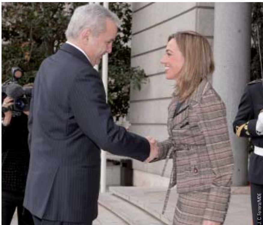
El ministro de Defensa libanés, Elías Murr, fue recibido por su homóloga española, Carme Chacón, en la sede del Ministerio de Defensa.

Sleiman agradeció a Zapatero el papel que desempeñan las tropas españolas en el sur de Líbano y le manifestó