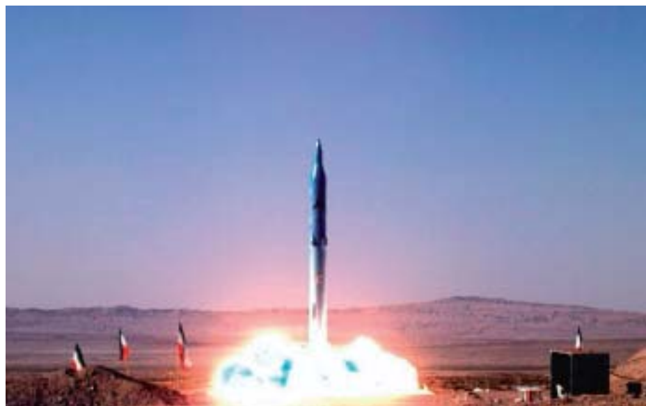
En este momento Irán —en la foto el lanzamiento de un nuevo misil tierra-tierra en Semnan el pasado mayo— es uno de los principales escollos para la no proliferación.

Para Karaganov, la rivalidad de ambos países en el espacio postsoviético, como Ucrania y Georgia, es el asunto principal que decidirá la dinámica de los vínculos bilaterales, no los asuntos de desarme, y los enemigos del acercamiento de Moscú y Washington tratarán de agudizar esa rivalidad para perjudicar el proceso de acercamiento. Por eso, reglamentar el antagonismo militar estratégico no basta para despejar el camino de las buenas relaciones bilaterales. Se necesitarían avan-