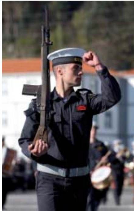
Los marineros ensayan la ceremonia de Jura de Bandera en el patio de armas.