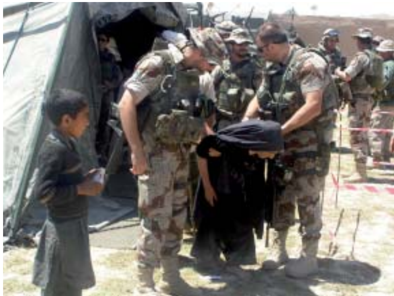
Los miembros de un equipo cívico-militar sujetan a una anciana afgana a la salida de un dispensario médico español.