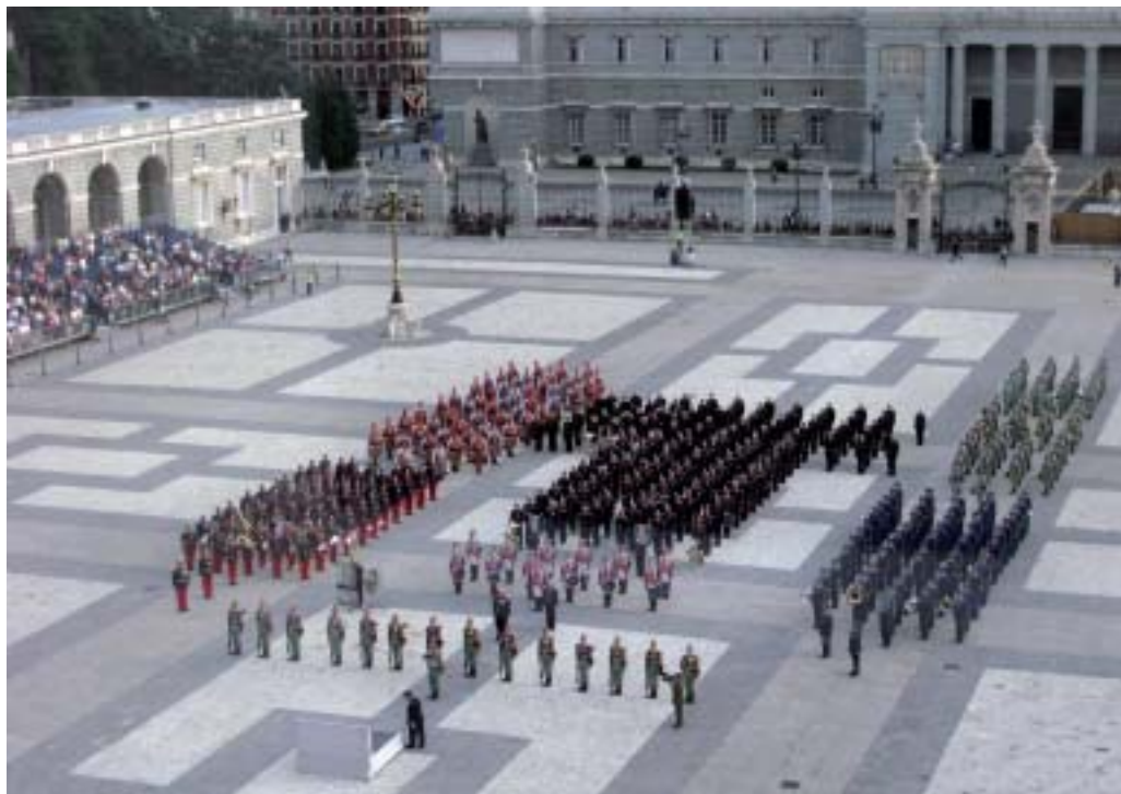
Las seis unidades concurrentes al certamen formadas en la Plaza de la Armería.