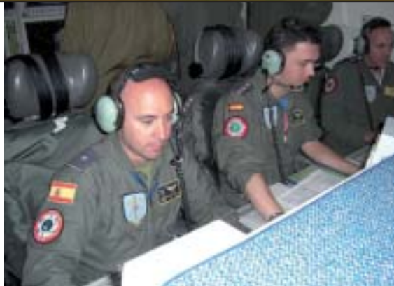
La presencia española entre los tripulantes de los AWACS de la OTAN cumple su décimo aniversario.

Así comienzan los preparativos de una misión de vigilancia en el Componente E-3A de la Fuerza Aerotransportada de Alerta y Control de la OTAN (NAEW CF), unidad operativa estable de la Alianza Atlántica cuya característica más sobresaliente es la de ser la única completamente multinacional. Pertenecen a la unidad personal de catorce países (Bélgica, Canadá, Dinamarca, Alemania, Grecia, Hungría, Italia, Países Bajos, Noruega, Polonia, Turquía, Portugal, Estados Unidos y España). Además de utilizar los diecisiete Boeing 707 de alerta y control, más conocidos por su acrónimo inglés de AWACS, está dotado con otros tres B-707 , dedicados al entrenamiento y transporte.