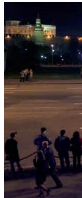
Los nuevos misiles balísticos estratégicos rusos Topol-M durante el ensayo del Día de la Victoria en Moscú.

Las malas relaciones con Georgia y el acercamiento del gobierno de este país a Estados Unidos siguen siendo una espina en las relaciones de Moscú con Washington, sobre todo después de la guerra que estalló en la zona en agosto de 2008, cuando tropas georgianas atacaron el territorio de Osetia del Sur, protegido