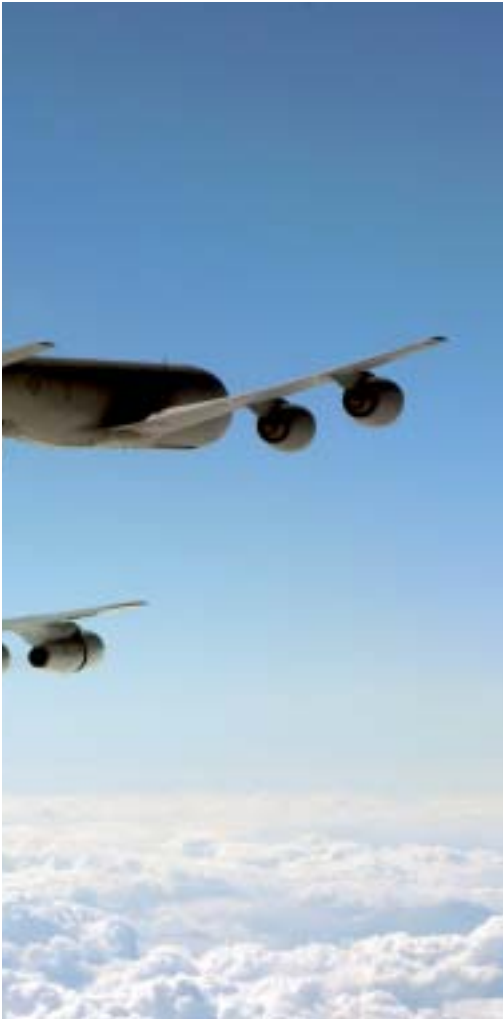
Un AWACS del Componente E-3A de la Alianza realiza una maniobra de reabastecimiento en vuelo.

las diez horas de misión Magic 01 pone rumbo a su base. Durante el tránsito de regreso los equipos se apagan y los técnicos realizan durante 70 minutos los chequeos en vuelo para estar seguros de que se encontraran operativos para la misión siguiente. Al mismo tiempo, el director táctico rellena el informe de misión para entregarlo nada más aterrizar. Detalla en el mismo todos los eventos del vuelo, las misiones asignadas y demás información para su posterior estudio.