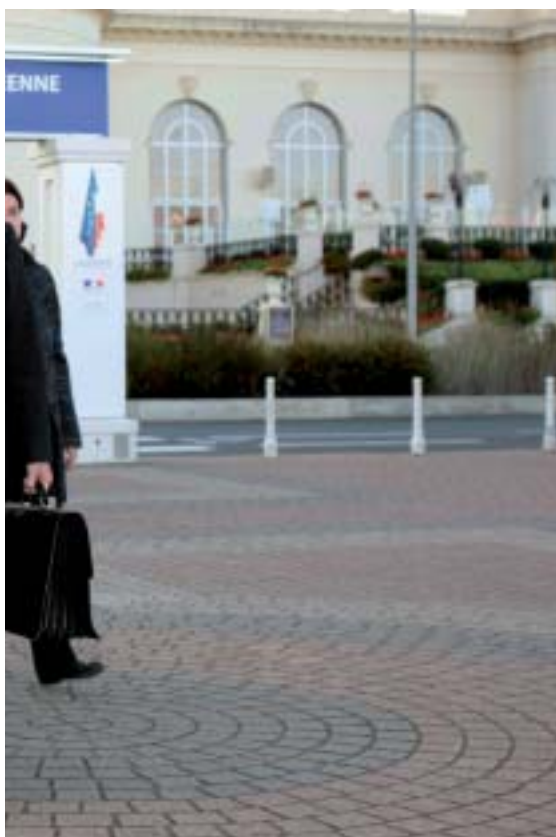
Juan Carlos Ferrera/MDE

Asimismo, estamos favoreciendo la incorporación de fuerzas iberoamericanas a operaciones internacionales de paz. Así lo hemos hecho con los países centroamericanos en la operación Althea en Bosnia-Herzegovina.