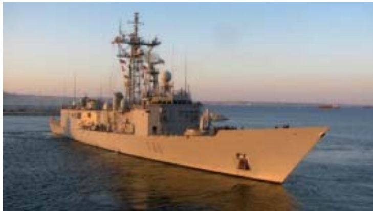
La fragata Canarias —en la foto— ha sido relevada temporalmente por la Méndez Núñez en el control y vigilancia del pesquero secuestrado.

gata tuvo como consecuencia la detención, en la noche del 4 de octubre, de dos de los piratas que habían abandonado el Alakrana y navegaban en un esquife. El Ministerio de Defensa entregó al mando de la operación Atalanta a los dos detenidos. En cumplimiento de la orden de ingreso en prisión dictada por la Audiencia Nacional, los piratas llegaban el 12 de octubre a la base