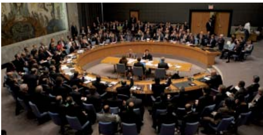
El Consejo de Seguridad de las Naciones Unidas durante la votación de la resolución sobre no proliferación de armas nucleares el pasado 24 de septiembre.

De características similares al SR-24 es el misil Topol-M , bautizado como SS-27 por la OTAN, considerado también por los rusos capaz de superar cualquier barrera antimisiles. El Topol-M es un misil móvil de 22,7 metros de largo, un diámetro de 1,95 metros y un peso de 47,2 toneladas, portador de una sola ojiva o cabeza.