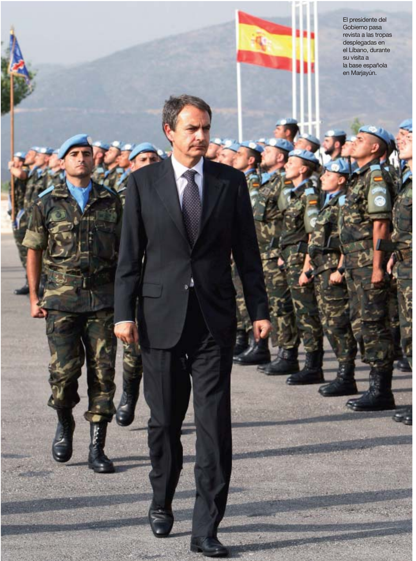
El presidente del Gobierno pasa revista a las tropas desplegadas en el Líbano, durante su visita a la base española en Marjayún.