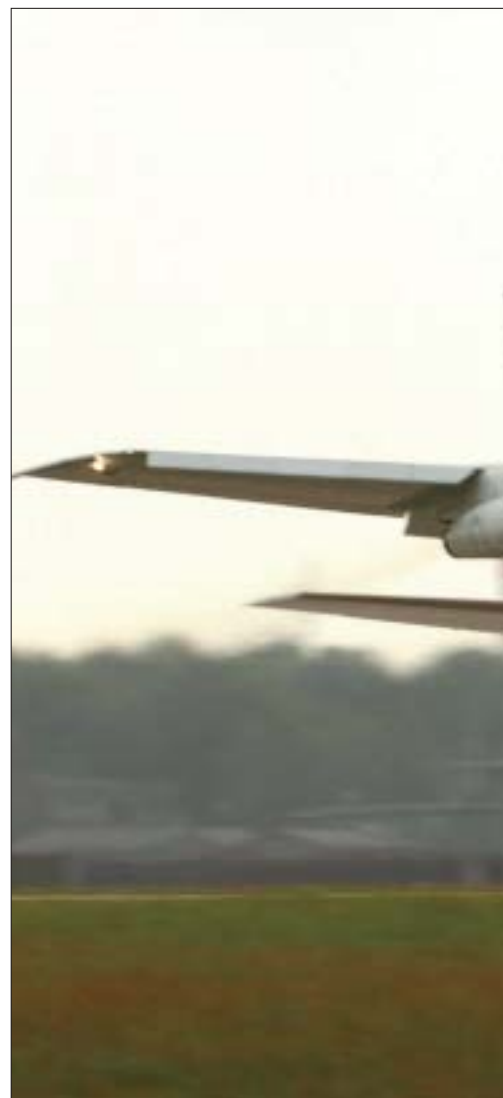
Un boeing 707 E-3A despegue desde su base en Geilenkirchen (Alemania) para realizar una misión de vigilancia aérea. El componente E-3A también dispone de tres B-707 para transporte y entrenamiento.

La tripulación es convocada para una reunión en la que se les expone los detalles de la labor encomendada. Cada sección se pone manos a la obra para estudiar todos los entresijos de la tarea asignada y establecer los parámetros que afectan a cada uno de sus miembros.