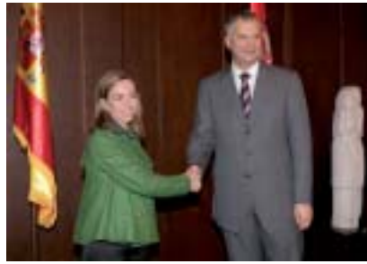
Juan Carlos Ferrera/MDE

Un día más tarde, el 14 de octubre, Carme Chacón se reunió con el ministro de Defensa serbio, Dragan Sutanovac, al que manifestó su apoyo para que unidades militares serbias participen junto a las españolas en operaciones de paz bajo bandera de la ONU. «Un instrumento fundamental para la transformación de sus Fuerzas Armadas, como lo fue para España en estos veinte años de misiones de paz», manifestó la ministra. Chacón también le transmitió el respaldo de España para la normalización de la situación política en los Balca-