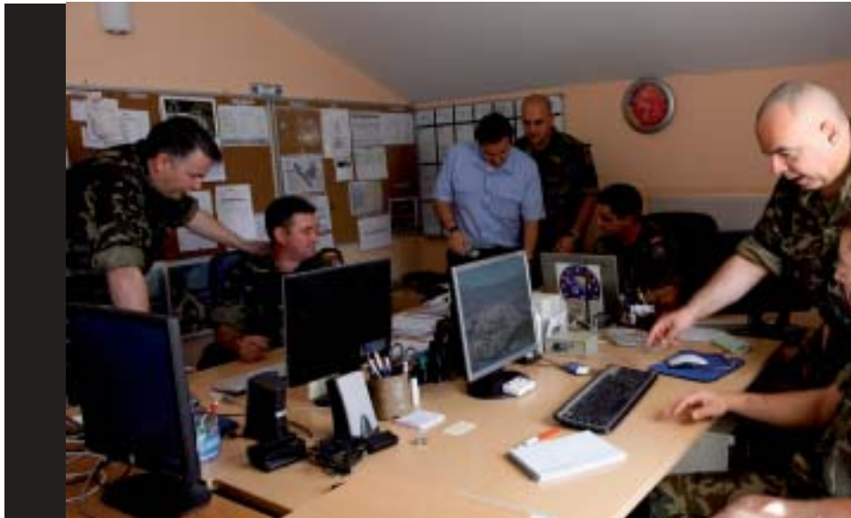
Los Equipos de Observación y Enlace españoles en Bosnia-Herzegovina cuentan con personal CIMIC para mantener un contacto directo con la población.