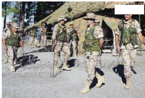
El general García-Vaquero (segundo por la dcha.) en unas maniobras en Gran Canaria. la opinión

El general Alfonso García-Vaquero pasará en breve a hacerse cargo de los 560 militares que conforman el operativo EUTMMali, (European Union Training Mission in Mali) tras su nombramiento como comandante de la misión de entrenamiento.