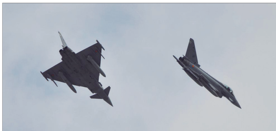
Ejército del Aire

La primera escala del buque será Santa Cruz de Tenerife desde donde partirá rumbo a Fortaleza (Brasil), San Juan de Puerto Rico, La Habana (Cuba), Miami y Baltimore (EEUU). El uno de julio recalará en Marín (Pontevedra), donde se ubica la Escuela Naval Militar.