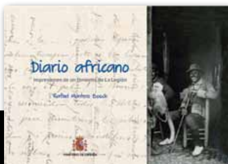
Diario Africano. Rafael Montero Bosch. Ministerio de Defensa