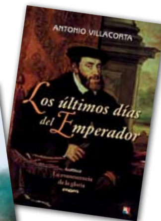
Los últimos días del emperador. Antonio Villacorta. Actas