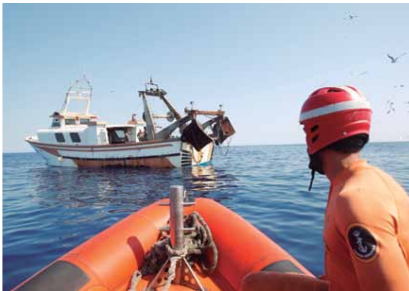
La embarcación neumática del Arnomendi aguarda próxima a un pesquero a que concluya la primera de las tres inspecciones programadas del día.

peccionados al menos en los dos últimos años. Era el caso del tarraconense Cinta Primera . Algunos de ellos presentaban, además, una frecuencia de desembarco en puerto muy elevada, lo que despertaba las sospechas de la Secretaría. La relación de embarcaciones y sus puntos de amarre se analizaron en la conversación que el comandante, su segundo y el jefe de operaciones del patrullero mantuvieron en la cámara de oficiales con el inspector durante la primera reunión de planificación de la campaña.