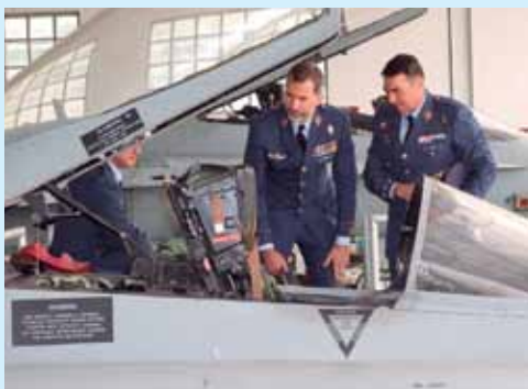
Casa de SM el Rey

Felipe VI recorrió el Ala 31, dotada con aviones de transporte C-130 Hércules. Allí fue informado de la progresiva sustitución de estas aeronaves por los modernos A400M a partir del próximo año y cuya entrega está previsto que se complete en 2022 con 14 aviones de este tipo. Las nuevas aeronaves superarán en capacidad de carga y de operatividad a sus antecesores. El Rey también tuvo la oportunidad de asistir a una sesión de prácticas en el