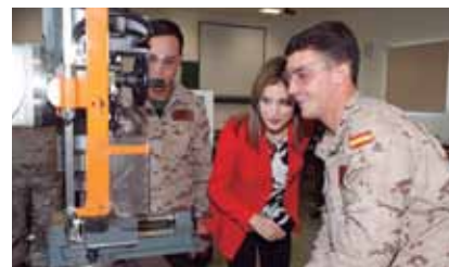
Casa de SM el Rey

En el polígono de Baterías, situado a las afueras de la ciudad, Doña Letizia visitó algunos de los talleres donde realizan sus