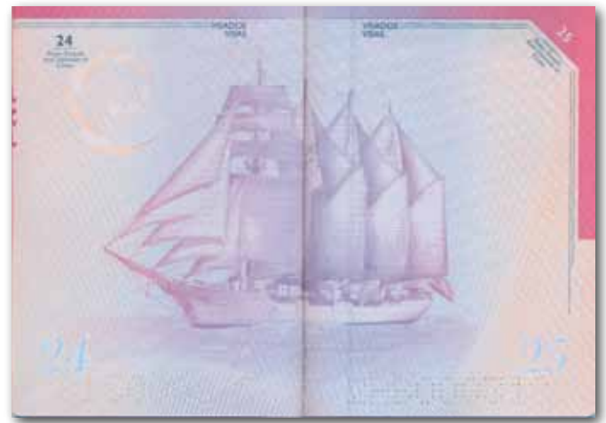
De izquierda a derecha, páginas dedicadas al BIO Hespérides y a la goleta bergantín Juan Sebastián Elcano .