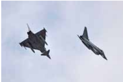
Ejército del Aire

Tras diez días de despegues y tomas, maniobras de evasión y suministro de combustible, los cerca de 40 aviones y más de 300 personas que han participado en el ejercicio DACT 2015 en Canarias han regresado a sus bases de procedencia. Estas maniobras, unas de las más importantes que desarrolla el Ejército del Aire, se encuadran dentro del