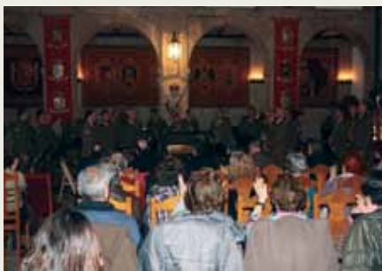
Cuartel General FLO

LOS últimos jueves y viernes de cada mes, el palacio de Capitanía General de La Coruña abre sus puertas a vecinos y forasteros, a quienes propone tres actividades diferentes en horarios asimismo distintos.