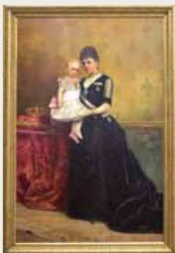
Museo del Ejército

La actividad, como es habitual, está programada los domingos a las doce y a la una del mediodía, y es gratis hasta completar el aforo.