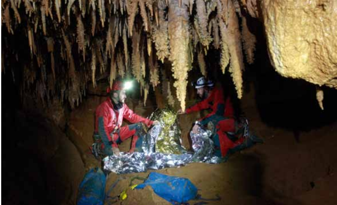
En el interior de la cueva, los rescatadores instalan un punto caliente para mantener confortable a la víctima. Debajo, la camilla alcanza la salida.

Pero un porteo bien hecho y con garantías evita colocar un montón de instalaciones. Se gana en tiempo y esfuerzo al tiempo que se evitan riesgos», puntualiza el brigada Medina.