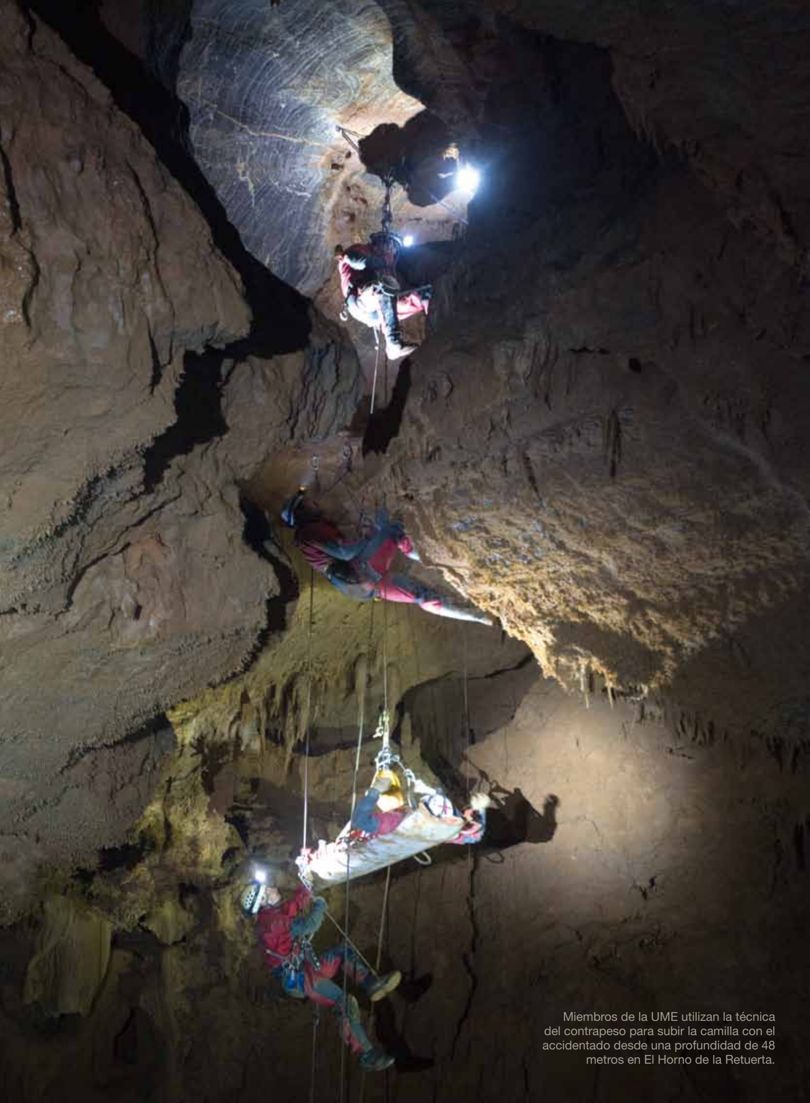
Miembros de la UME utilizan la técnica del contrapeso para subir la camilla con el accidentado desde una profundidad de 48 metros en El Horno de la Retuerta.