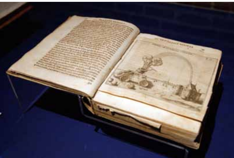
Tratado de Artillería , de Diego Ufano, impreso en Bruselas en 1612 y perteneciente a la biblioteca de la academia de la segoviana.

Tras un año de investigación, búsqueda y preparación del discurso expositivo, el teniente coronel Guerrero espera que