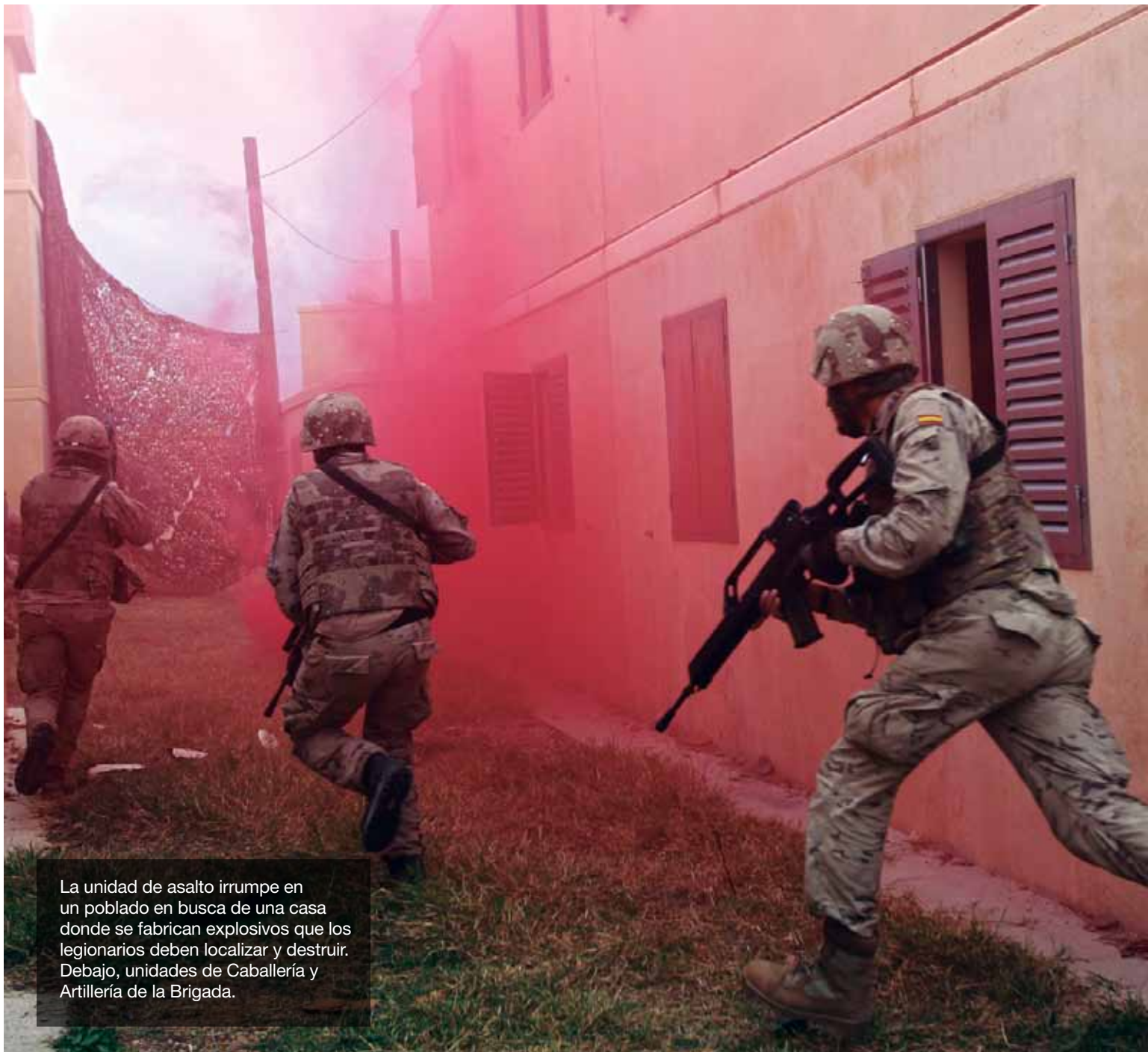
La unidad de asalto irrumpe en un poblado en busca de una casa donde se fabrican explosivos que los legionarios deben localizar y destruir. Debajo, unidades de Caballería y Artillería de la Brigada.