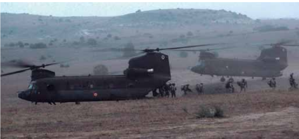
Componentes de la X Bandera desembarcan de los Chinook en una operación de helitransporte para la infiltración aérea realizada en la zona de Casas Altas.

El escenario del ejercicio simulaba un entorno operativo de alta intensidad y amenaza híbrida, como Afganistán