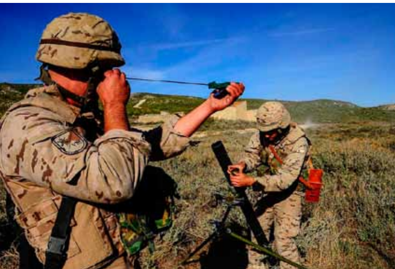
Vehículos Centauro y VEC del Grupo de Caballería preparados para entrar en acción en el CENAD de San Gregorio. A la izqda. la sección de morteros realiza un ejercicio de fuego real, y un vehículo RG-31 circula por el campo de maniobras.