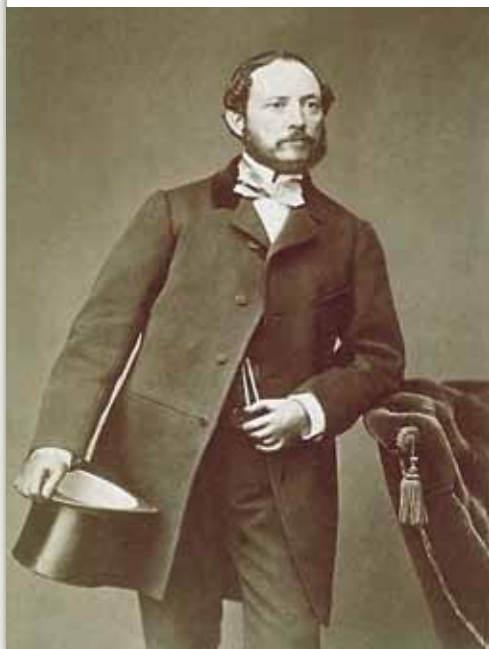
Museo del Ejército

UNIDA al título Juan Prim y Prats, de soldado a presidente , llega la actividad estrella del Museo del Ejército ( www.museo.ejercito.es ) para este fin de año. En su sede del Alcázar de Toledo, la institución rinde homenaje al ilustre militar y político del siglo XIX nacido en Reus (Tarragona) hace ahora dos siglos, el 6 de diciembre de 1814. Está previsto que dicha muestra se inaugure el día 25 del presente mes y, según la programación actual, podrá visitarse hasta el 12 de abril. La misma agenda incluye un programa de conferencias, que se inaugura el 6 de noviembre con la ponencia Prim. Perfil humano de un espadón , que estará a cargo del catedrático de Historia Contemporánea de la Universidad de Granada, Fernando Fernández. La cita será a las 19:00 horas en el auditorio del museo.