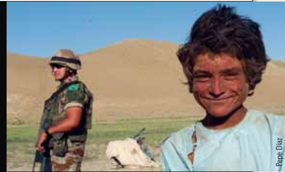
Izquierda, infografía sobre la presencia de militares españoles en África. Arriba, instantánea del libro sobre la operación en Afganistán.

la propuesta habitual a este instituto vallisoletano, que también va a organizar durante el presente curso 2014-2015 otras actividades para acercar las Fuerzas Armadas a sus alumnos.