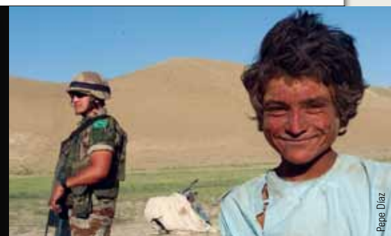
Izquierda, infografía sobre la presencia de militares españoles en África. Arriba, instantánea del libro sobre la operación en Afganistán.

la propuesta habitual a este instituto vallisoletano, que también va a organizar durante el presente curso 2014-2015 otras actividades para acercar las Fuerzas Armadas a sus alumnos.