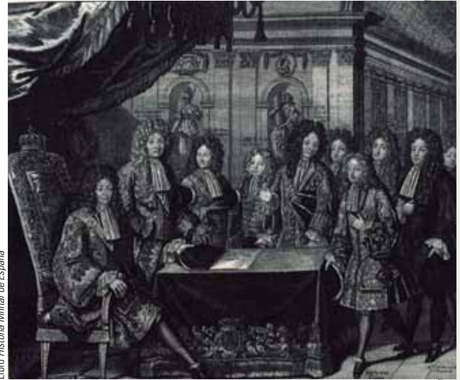
Litografía Historia Militar de España