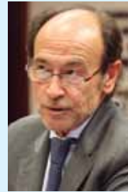
Santiago López Valdivielso Presidente de la Comisión de Defensa del Senado

A la importancia de la moción —en su contenido, objetivo y literalidad— hay que añadir que fue aprobada por una gran mayoría de votos, los de los senadores de todos los grupos parlamentarios presentes, excepto el de Convergencia i Unió que votó en contra. Como presidente de la Comisión de Defensa del Senado constituye para mí una satisfacción que desde la misma se colabore en ese objetivo de que los ciudadanos, en este caso los más jóvenes, conozcan, se impliquen y entiendan la necesidad de incrementar una cultura de la Defensa Nacional pidiendo al Gobierno la elaboración de este plan.