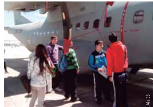
Grupos de alumnos en la base aérea de

Alumnos de 125 colegios madrileños se han integrado durante unos días de abril en varias unidades militares