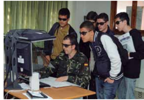
Algunas de las unidades participantes este año han sido la Brigada Paracaidista, la Unidad Militar de Emergencias, el Centro Geográfico