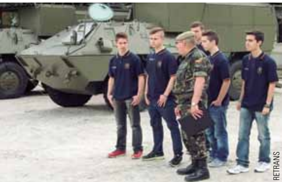
del Ejército y la Agrupación Hospital de Campaña.