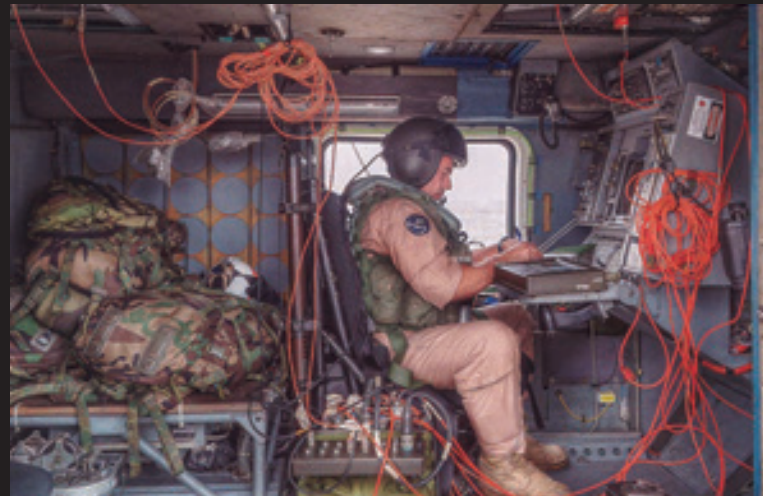
Imagen de Huertas, incluida en la obra, y que muestra a un operador del sistema datalink de los helicópteros Seahawk .