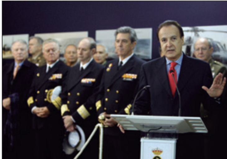
El autor, en un momento de la presentación del libro en la carpa donde también se inauguró su exposición.