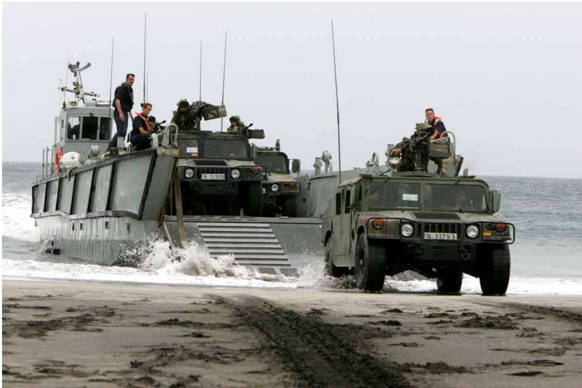
ACTO DESPEDIDA FUERZA EXPEDICIONARIA DE INFANTERÍA DE MARINA EN LÍBANO (FIMEX-L)