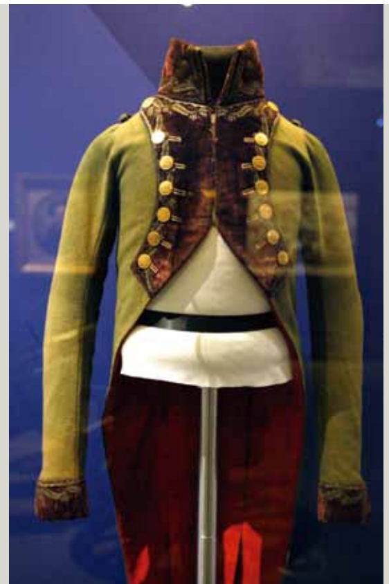
Casaca de estado mayor de Artillería del capitán Velarde (Fundación Botín).

Panorámica de uno de los espacios de la muestra en el antiguo cuartel madrileño. A la derecha, reloj de sol con pieza de artillería del año 1850.