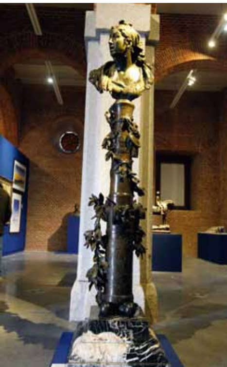
Homenaje a Agustina de Aragón, de Mariano Benlliure.