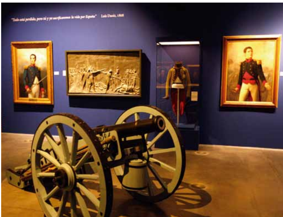
En el área Los artilleros y el gran día de la Independencia , los protagonistas son los héroes del 2 de Mayo madrileño Daoiz (cuadro de la izqda.) y Velarde, a la derecha.

A su esposa, Beatriz Galindo la Latina , por ser mujer versada en Letras y maestra de reinas, debe su nombre uno de los barrios más populares del centro histórico de la ciudad, un distrito de la capital... y cuenta con una escultura en