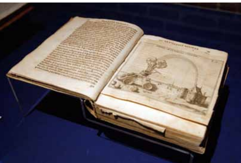
Tratado de Artillería , de Diego Ufano, impreso en Bruselas en 1612 y perteneciente a la biblioteca de la academia segoviana.