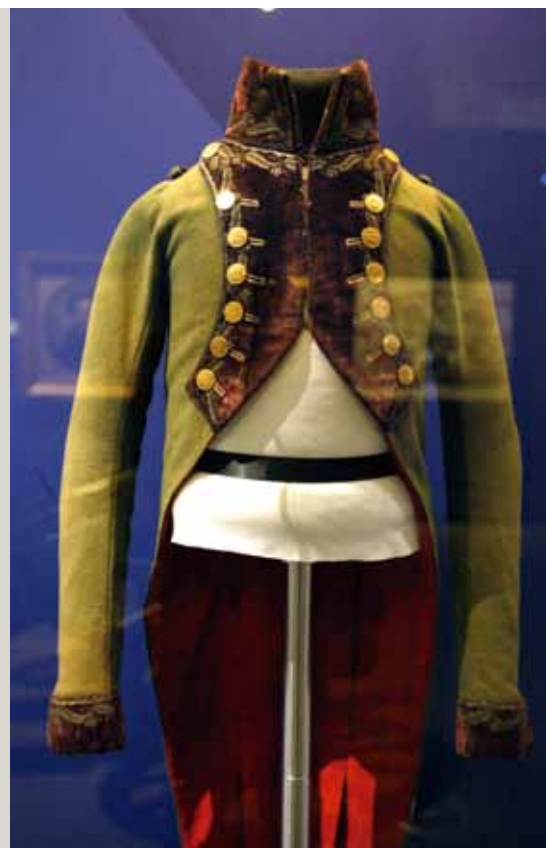
Casaca de estado mayor de Artillería del capitán Velarde (Fundación Botín).

Panorámica de uno de los espacios de la muestra en el antiguo cuartel madrileño. A la derecha, reloj de sol con pieza de artillería del año 1850.