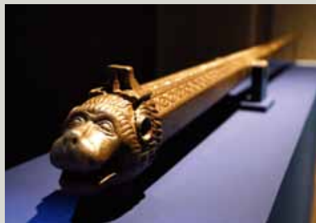
«Mosquete de orejas», con el nombre del emperador Carlos V grabado.