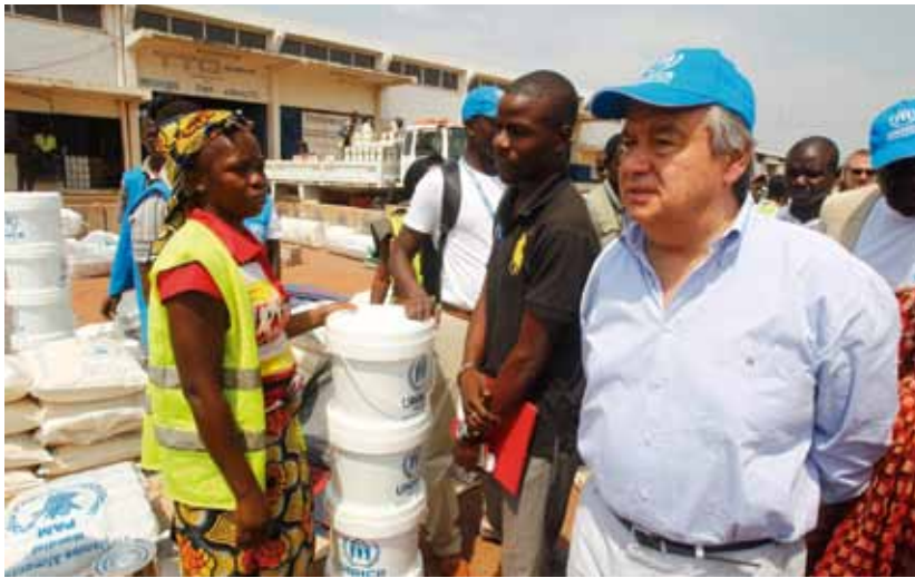
El Alto Comisionado de la ONU para los Refugiados, Antonio Guterres, visita un campo de desplazados en Bangui el pasado 12 de febrero.

Por su parte, MISCA —bajo el mando del general Michel Mokoko— enfrenta muchos más problemas, y su presencia en el país no está dando los resultados esperados por la comunidad internacional. En la actualidad, con 6.000 militares y policiales sobre el terreno, las fuerzas africanas no están cohesionadas, no tienen una estructura firme de mando y control, y presentan importantes carencias materiales, logísticas y de financiación para salir de Bangui. A pesar de ello, 2.000 efectivos ya despliegan, con una cuestionada eficacia, en localidades como Bangui, Bouar y Bozoum, en el norte, o Bangassou, en el este. Sin embargo, el principal obstáculo para MISCA es la desconfianza por