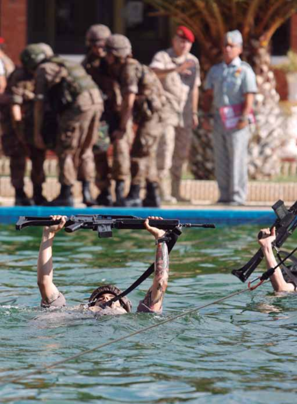
Cadetes de primer curso de la Academia General Militar realizan una práctica de vadeo de circunstancias en su periodo de formación militar (arriba), mientras alumnos del Centro Universitario de la Defensa de San Javier asisten a una clase de ingeniería (abajo).