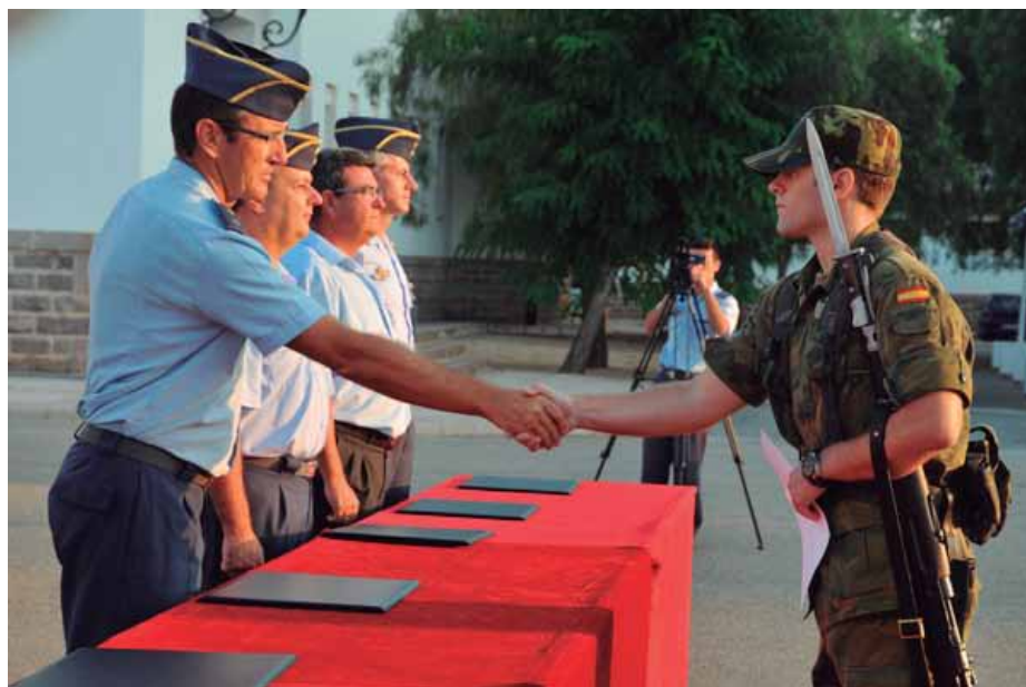
Academia General del Aire