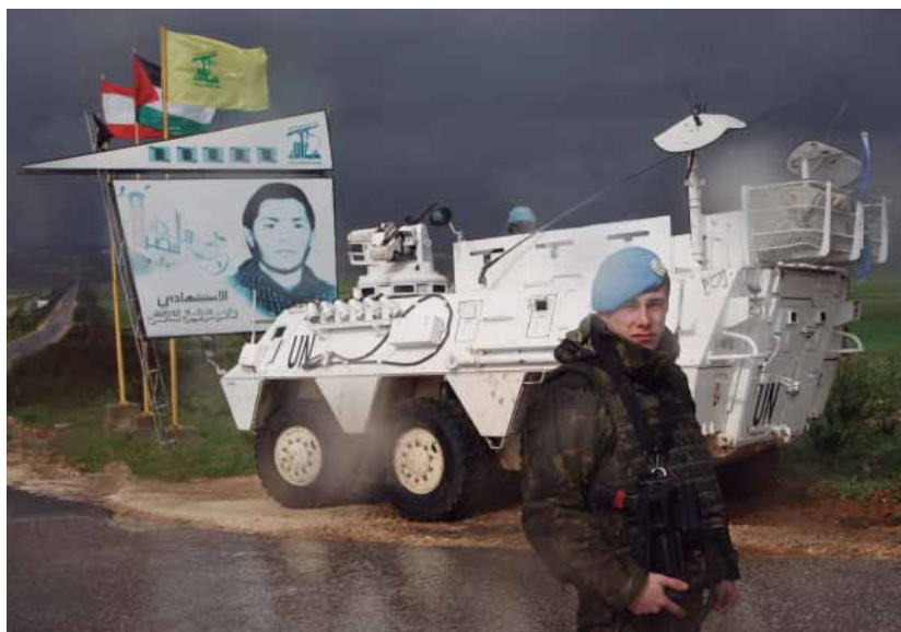
La vigilancia ha sido la principal tarea de los integrantes de las Fuerzas Armadas que han prestado servicio en tierras libanesas.

«Sé que eso es imposible —añade—, así que lo que me planteo ahora es trabajar para que llegue a todos los rincones de España, que se conozca, que sirva para analizar la misión y para que la socie-