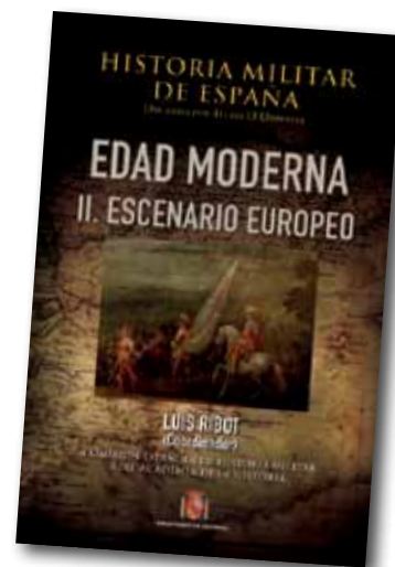
Historia Militar de España. Edad Moderna. Coord. Luis Ribot. MDE.

García recuerda que el libro se centra en las acciones terrestres y destaca entre sus aportaciones, al día con las investigaciones más recientes, la confirmación de la «enorme capacidad de recuperación de los ejércitos de los Austrias» y un dato novedoso relacionado con el anterior: «no hubo decadencia en los ejércitos hispánicos de finales del siglo XVII, a pesar de lo que ha postulado la historiografía tradicional».